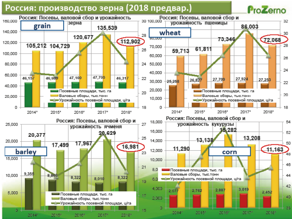
Россия: Производство зерна (ПроЗерно), тыс.т

Что касается российской экономики, то основная проблема заключается в отсутствии дополнительных возможностей для увеличения спроса на продовольствие. Здесь значимую роль играют потребительские кредиты, которые хоть как-то поддерживают спрос