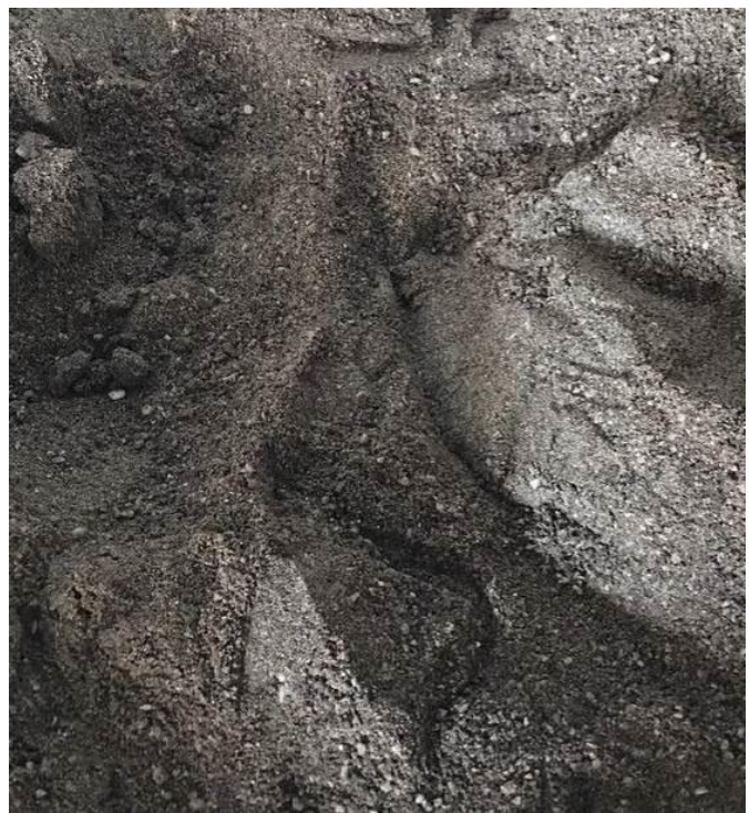
Фото 1 и 2 – Мука мясокостная 2 сорта