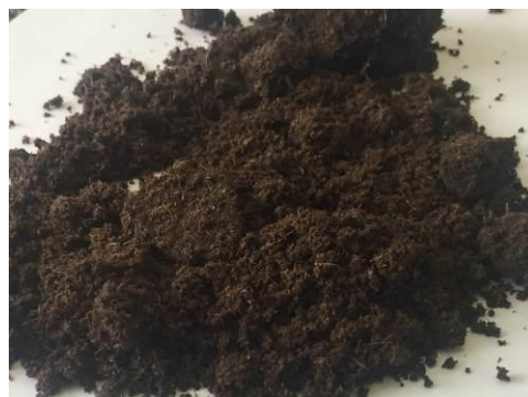
Фото 3 и 4 – Мука мясокостная 3 сорта