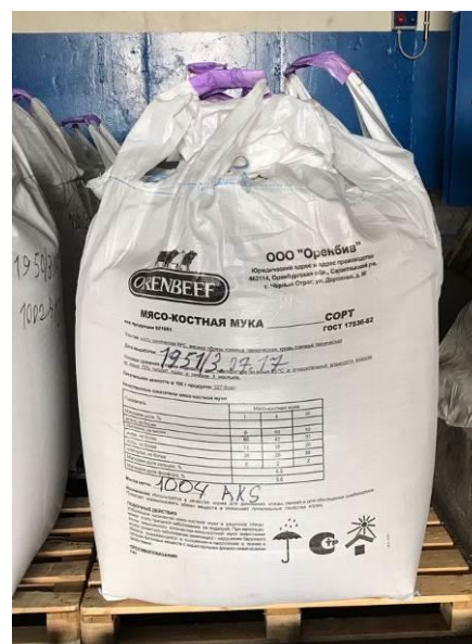
Фото 5 и 6 – Мука мясокостная упакованная