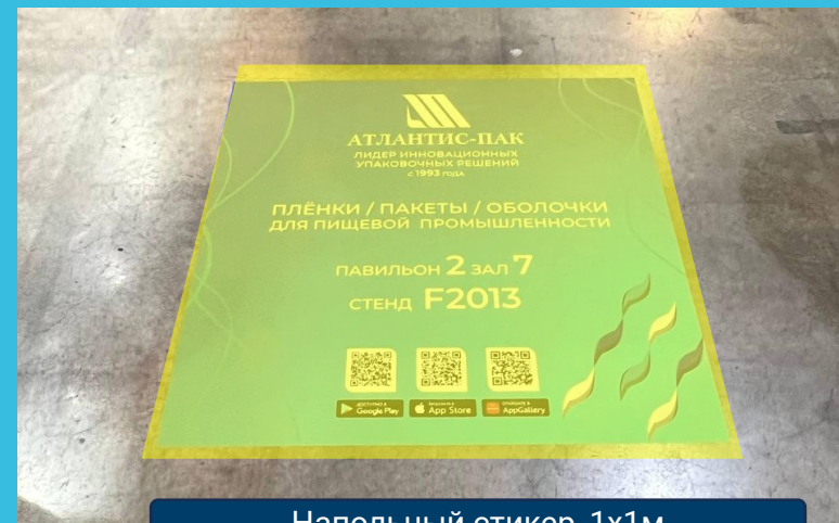
Напольный стикер, 1x1м