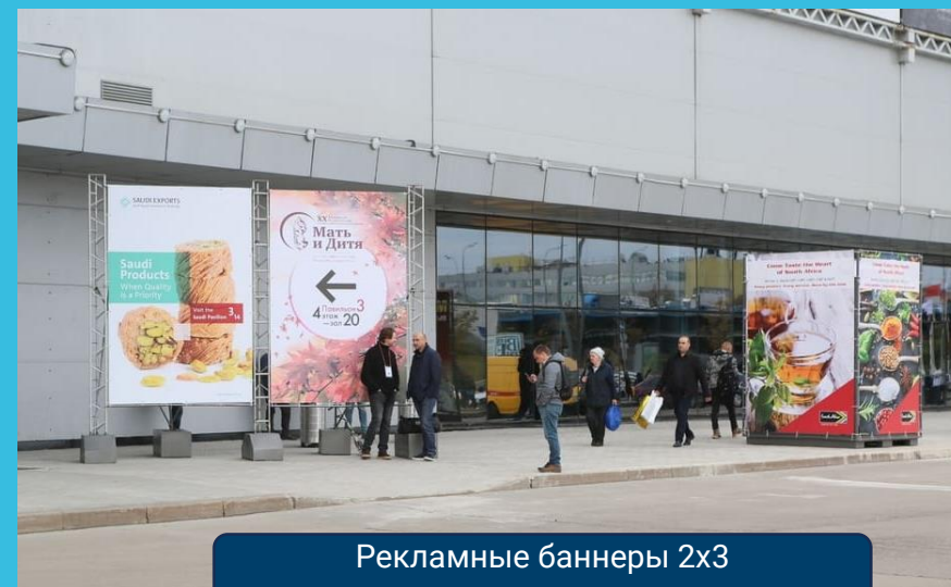
Рекламные баннеры 2х3 и прямоугольная конструкция