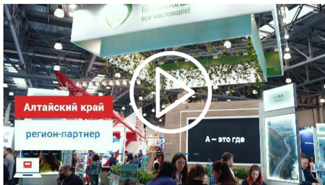
Отчётное видео о выставке MITT 2022