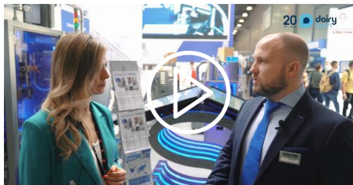
Интервью с представителем компании TAURAS-FENIX, участником DairyTech 2022