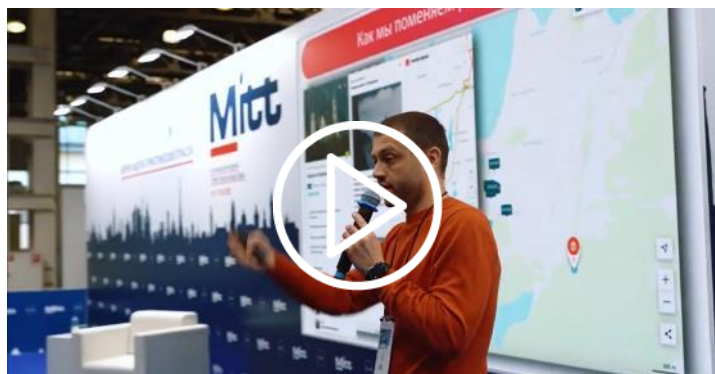
Отчётный ролик деловой программы MITT 2022