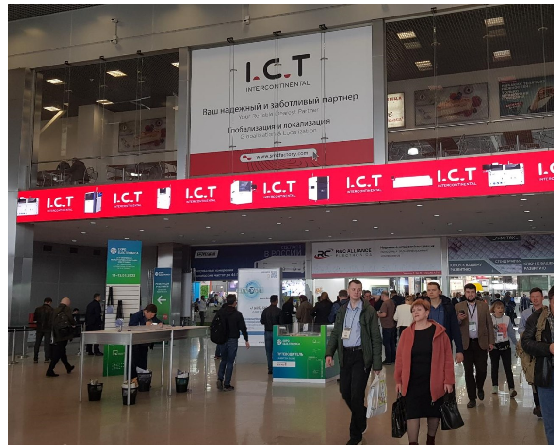
Рекламный ролик партнера и оклейка балкона второго этажа