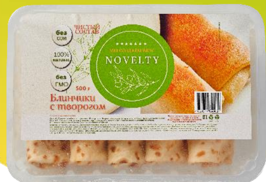
блинчики с творогом