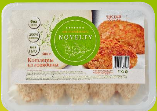
котлеты из говядины