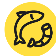
Рыба и морепродукты