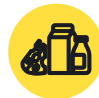
Молочная продукция и сыры