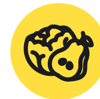
Фрукты и овощи