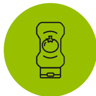
Масложировая продукция и соусы

Это позволяет закупщикам всего за 4 дня сформировать комплексную продуктовую матрицу, отвечающую самому актуальному спросу.