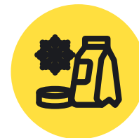
Замороженная продукция, полуфабрикаты и готовая кулинария