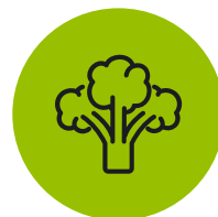
Здоровое питание и органика