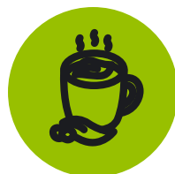
Чай и кофе