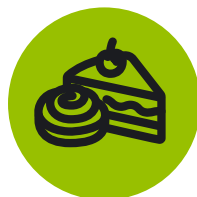
Кондитерские и хлебобулочные изделия