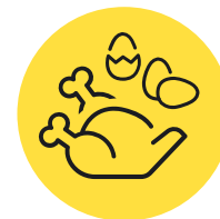
Мясо, птица и яйца