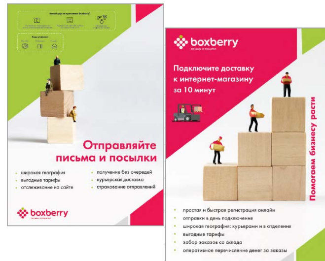
2. Информационные плакаты (2 шт.)