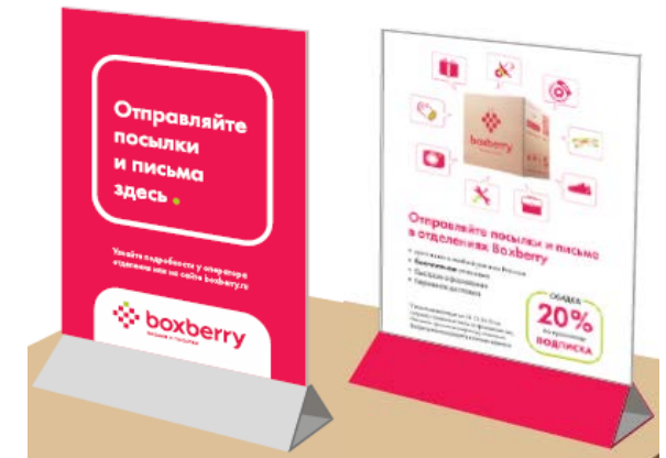
3. Тейбл-тент А5 с листовкой