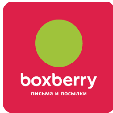
1. Вывеска с логотипом на входе

Для оформления отделения обязательны к размещению всего три элемента брендинга, которые мы предоставим бесплатно!