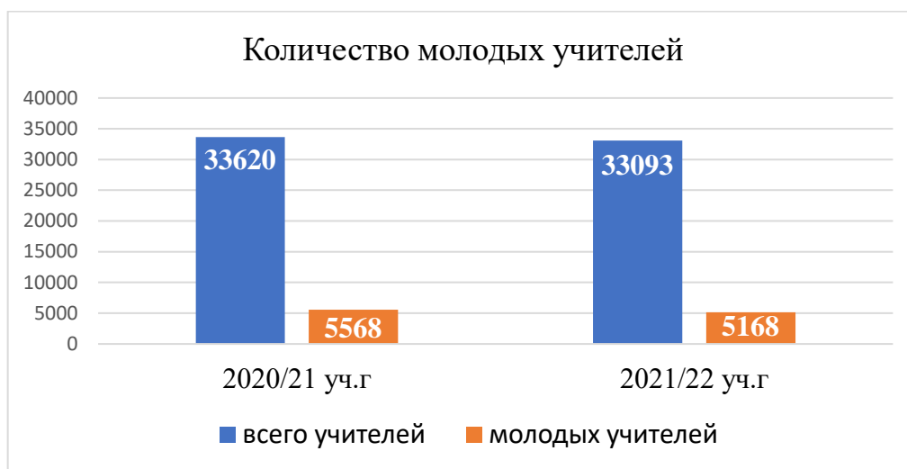
Диаграмма №1 «Количество молодых учителей»

Наибольшая доля молодых педагогов в 2021/22 уч.году, как и в 2020/21 уч.году, принадлежит Городскому округу г. Стерлитамак (27,5%) , так же большая доля молодых педагогов в 2021/22 уч году в Бурзянском (23,5%), Ишимбайском (22,4%), Иглинском (22%) районах и городском округе г.Уфа (22,8%).