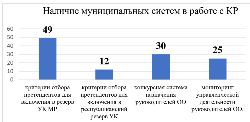
Диаграмма №2 «Анализ работы МО с кадровым резервом»