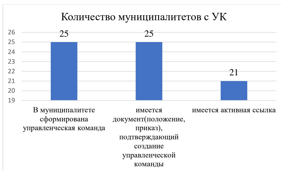
Диаграмма №1 «Анализ работы МО с кадровым резервом»