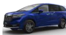
Aurora Blue (синий)