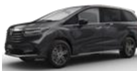
Polar Night Silver (темно-серый)