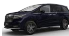
Stellar Sky Blue (темно-синий)