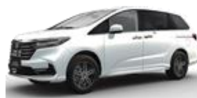
Moon & Star White (белый)