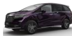
Transient Illusion Purple (фиолетовый)