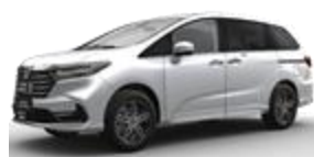
Greenland White (белоснежный)