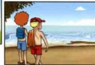
go to the seaside