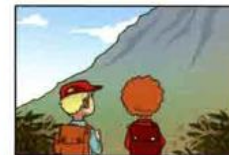
go to the mountains