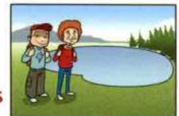
go to the lake