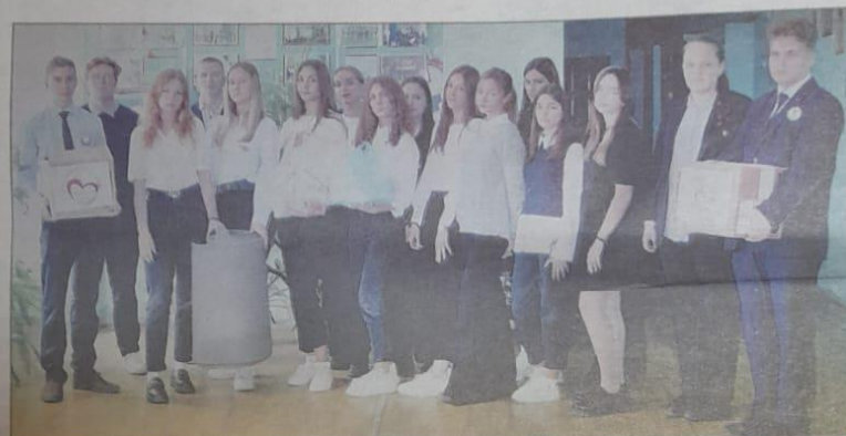
Активисты добровольческого отряда «Импульс» не остались в стороне от важных событий.

«С добротой души и по воле сердца» – именно такой негласный девиз определен в добровольческом отряде «Импульс», действующем на базе лицея № 4 г. Данкова. На счету волонтеров – марафон добрых дел.