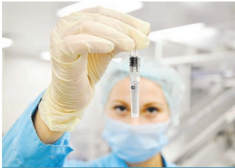
Своевременная вакцинация позволяет минимизировать риски заболевания гриппом