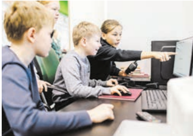
СЛУЖБА УПРАВЛЕНИЯ ПЕРСОНАЛОМ ОАО «РЖД»

«Петербургские школьники в течение учебного года бесплатно знакомятся с железнодорожным транспортом и железнодорожными профессиями, затем успешно выступают на чемпионатах «Молодые