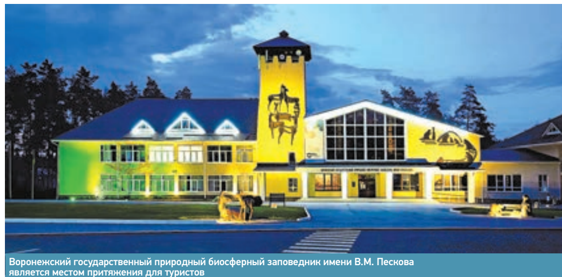
Воронежский государственный природный биосферный заповедник имени В.М. Пескова является местом притяжения для туристов

Железнодорожники реализуют проект в заповедном месте