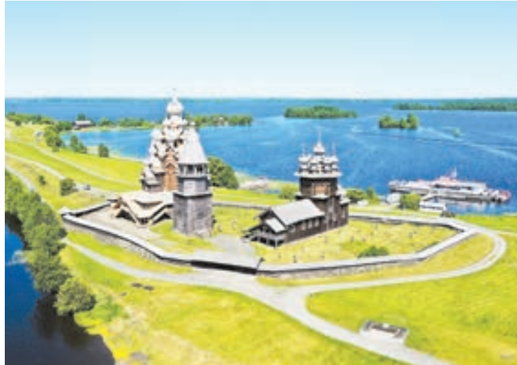
У пассажиров «Карельского вояжа» есть возможность побывать на острове Киж

По возвращении из путешествия организаторы опросили пассажиров, собрали отзывы и выяснили, что ещё необходимо сделать. После этого тур был