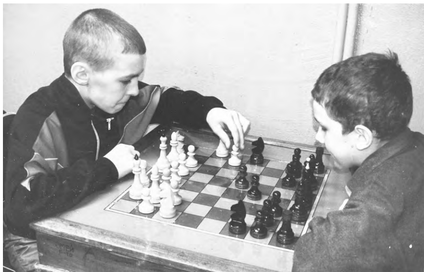
Турнир. 6 мая 1999