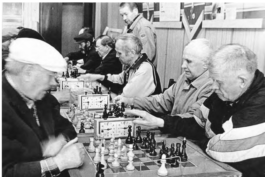
Шахматы. Турнир, май, 2002