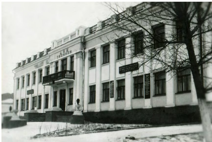
Дом техники, ул. Ильича, 7. 1960-е

— Красный уголок рудника первоуральского динасового завода. В центре — новогодняя ёлка. Нарядные девочки и мальчики водят хоровод, а я, тоже нарядная, в кукольном газовом платье, сшитом моей бабушкой, сижу с папой за шахматным столиком и сосредоточенно пытаюсь передвигать шахматные фигуры.