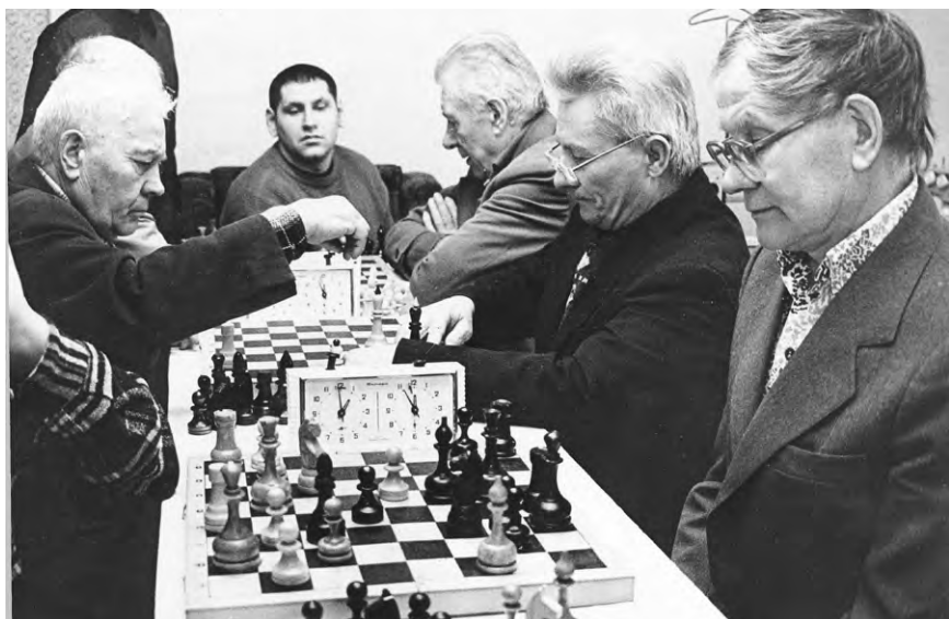
Шахматы. Спортивный праздник Лювена. Декабрь, 2001