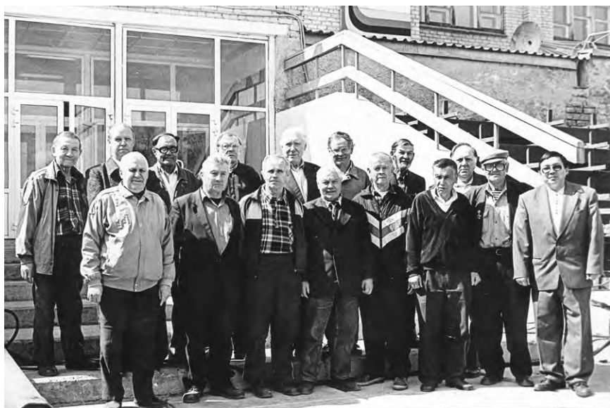
Шахматы. Турнир, май, 2002