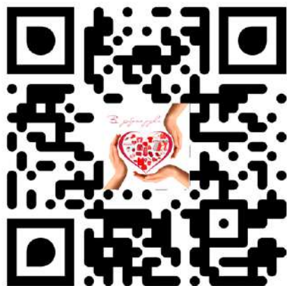
Проект “Добрые руки”