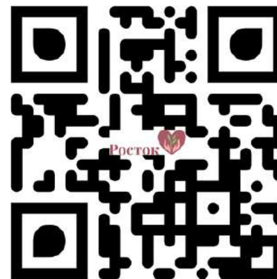
АНО Центр развития и поддержки семьи “Росток”