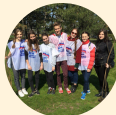
АЗОВСКОЕ ГОРОДСКОЕ МЕСТНОЕ ОТДЕЛЕНИЕ РОСТОВСКОГО РЕГИОНАЛЬНОГО ОТДЕЛЕНИЯ ВСЕРОССИЙСКОЙ ОБЩЕСТВЕННОЙ ОРГАНИЗАЦИИ МГЕР