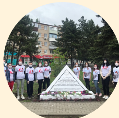
ОТДЕЛЕНИЕ ВСЕРОССИЙСКОГО ОБЩЕСТВЕННОГО ДВИЖЕНИЯ "ВОЛОНТЕРЫ ПОБЕДЫ" В ГОРОДЕ АЗОВЕ