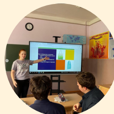
ОТДЕЛЕНИЕ ВСЕРОССИЙСКОЙ ОБЩЕСТВЕННОЙ ОРГАНИЗАЦИИ ПО РАЗВИТИЮ ДОБРОВОЛЬЧЕСТВА В ПРИРОДООХРАННОЙ СФЕРЕ «ДЕЛАЙ!» В ГОРОДЕ АЗОВЕ