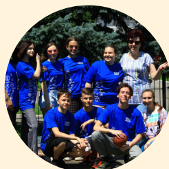
ШТАБ ВОЛОНТЕРСКОГО ДВИЖЕНИЯ ШКОЛ "ДИАЛОГ"