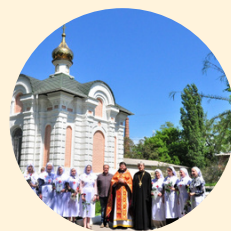
ПРИХОД ХРАМА СВЯТИТЕЛЯ ЛУКИ КРЫМСКОГО ГОРОДА АЗОВА