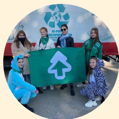
АВТОНОМНАЯ НЕКОММЕРЧЕСКАЯ ОРГАНИЗАЦИЯ ЭКОЛОГИЧЕСКОЙ НАПРАВЛЕННОСТИ "ЭКА-АЗОВ"