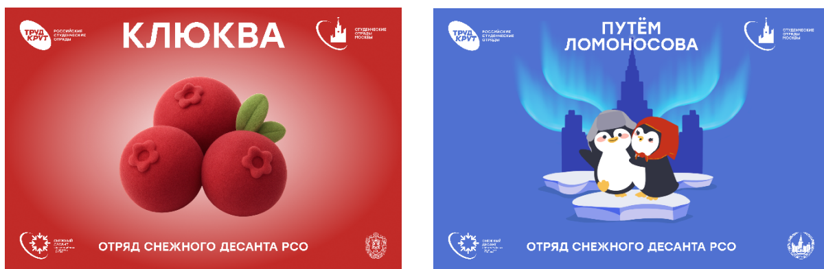
Рисунок 3, б

Флаг десанта разрабатывается его участниками, утверждается на общем собрании и согласуется с региональным или местным штабом МООО «РСО».