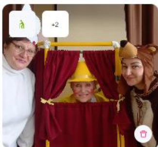
Театр вне возраста

В рамках 7 собственных волонтерских проектов Учреждения ключевые направления работы: корпоративное, экологическое, патриотическое, событийное волонтерство.