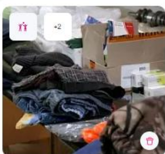
Помощь российскому солдату