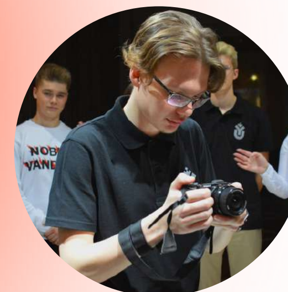
Медиа - волонтерство