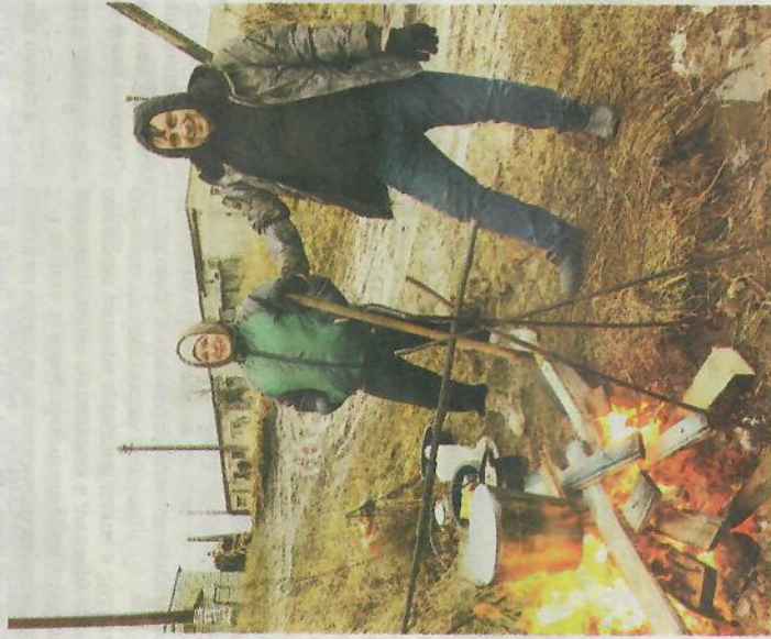
На один день общественный деятель стал участником проекта #НеВетхье.