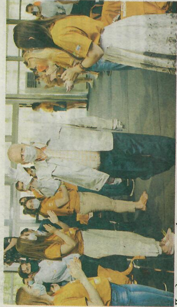
Перед участниками форума выступали ведущие политические лидеры страны.