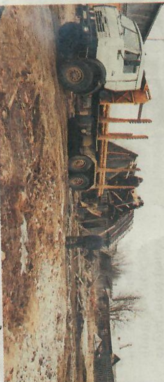
Работа по благоустройству территории продолжается.

Началось все с демонтажа строения в поселке Гремячий, на улице Советская. После уборки аварийного здания осталось очень много кирпичей, досок, мусора и т.д. Было решено довести дело до конца. К работникам администрации Раменского поселения присоединились неравнодушные местные жители, которые на добровольных началах помогли облагоустроить территорию родного поселка. Было вывезено три телеги кирпича, который в будущем будет использоваться для строительства кон-