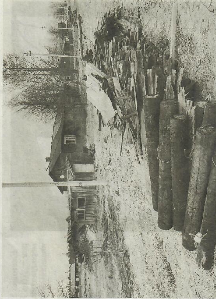
На данный момент активистами Раменского поселения разобрано несколько аварийных зданий, хозяйственные постройки, бани и дворы, гараж, другие малогабаритные сооружения и несколько заборов.

Подготовила Дмитрий СМIRНОВ , Фото Ксении ГНЕЗДИЛОВОЙ .