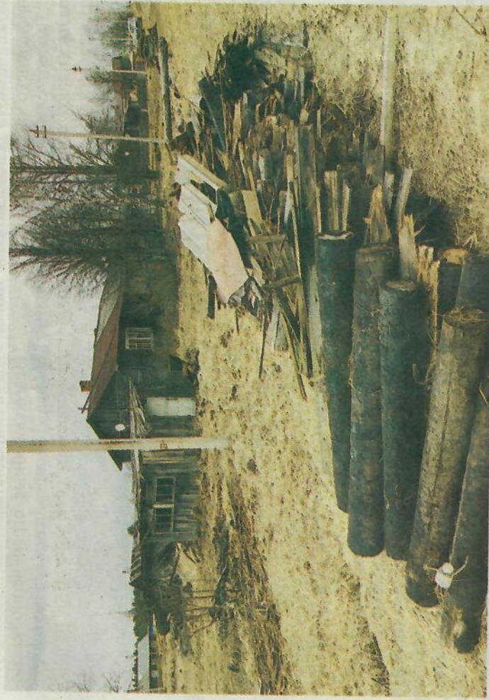
Идея создания проекта #НеВетхие появилась во время демонтажа здания на улице Советской в поселке Гремячий.

Дмитрий СМИРНОВ.