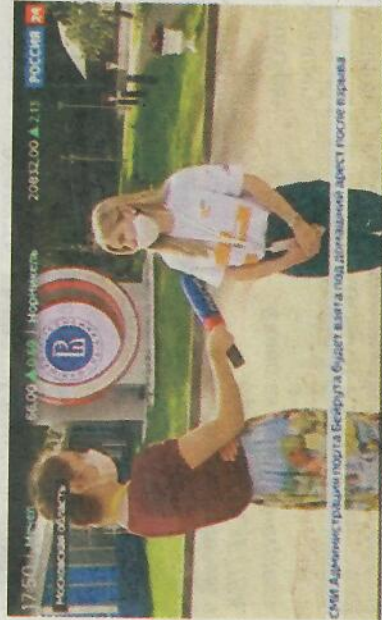
Интервью для федерального канала – волнительный момент.

щем счете более 10 строений, среди которых: склады, пекарня, помещение бесхозного хлебного магазина, придомовые здания, заборы и т.д. В результате проведенных работ с облагоустроенных территорий вывезено более 100 мешков мусора. Хороший материал, оставшийся после демонтажа (доски, бревна и т.д.), предлагается населению для личного пользования на безвозмездной основе, остальное