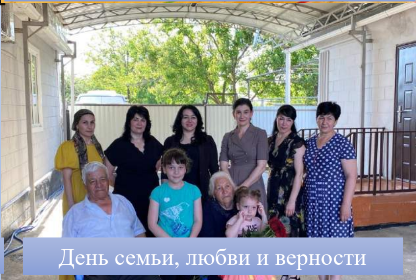
День семьи, любви и верности