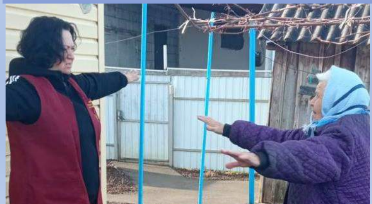
«Санаторий на дому»