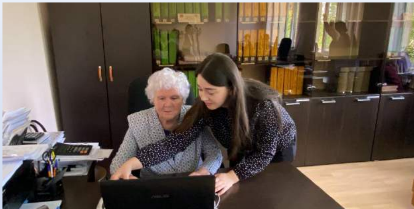
Профилактика по безопасности финансовой и правовой грамотности