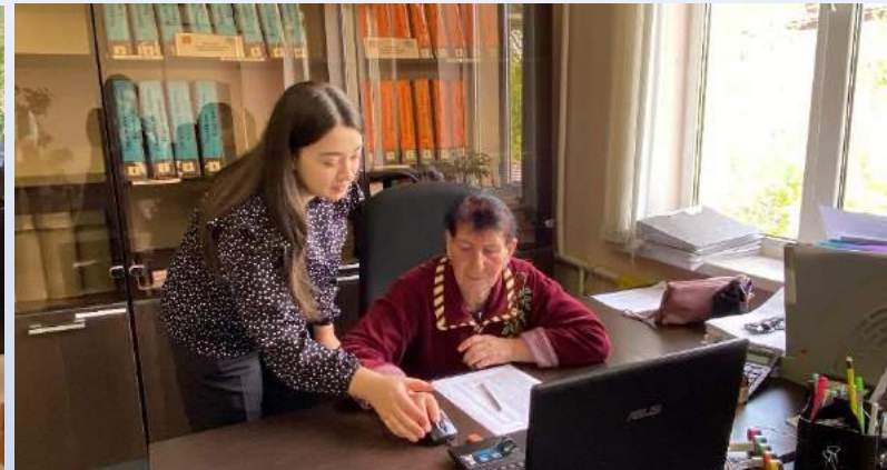
Компьютерное и Smart-обучение