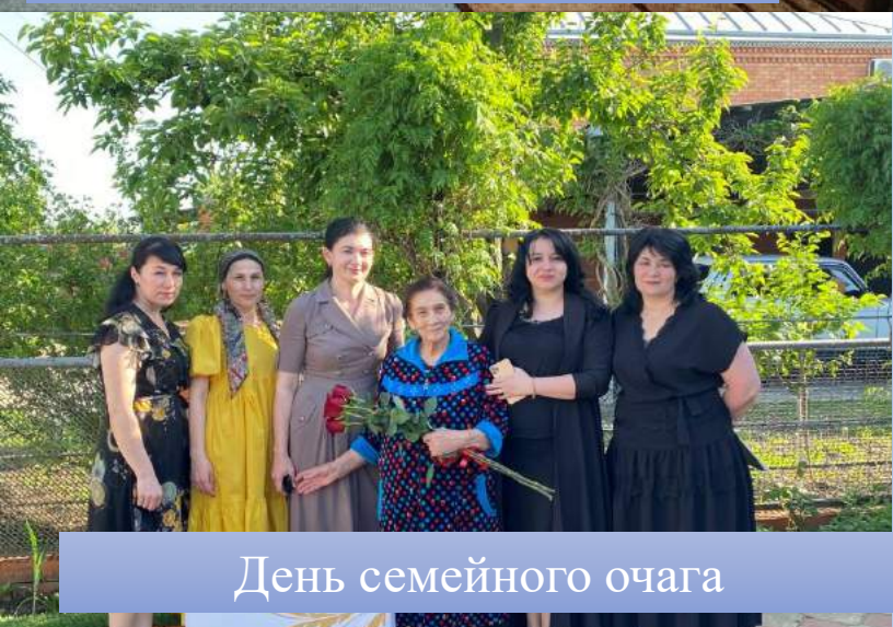
День семейного очага