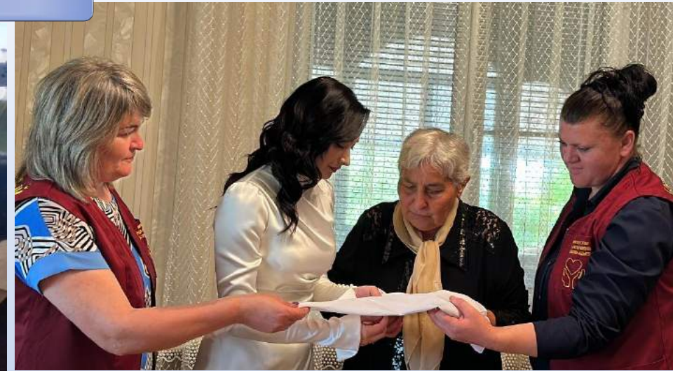
Клуб «Адыгэ шэн, Адыгэ хабзэ!»