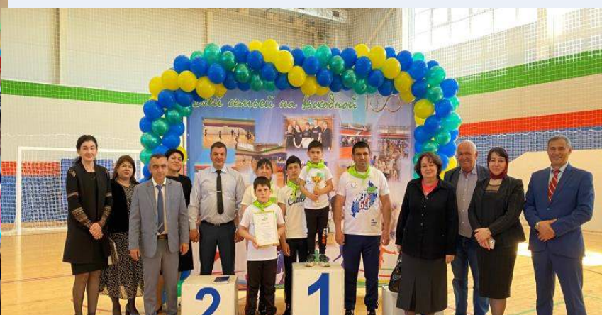
Всей семьей на выходной