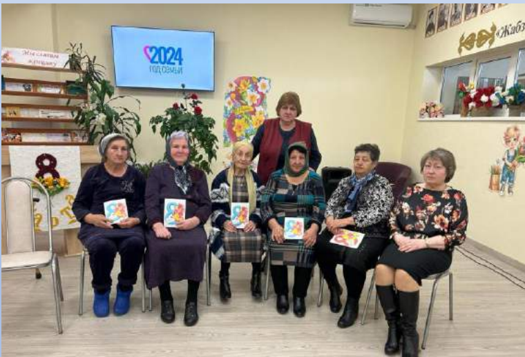
Клуб «Школа активного долголетия»