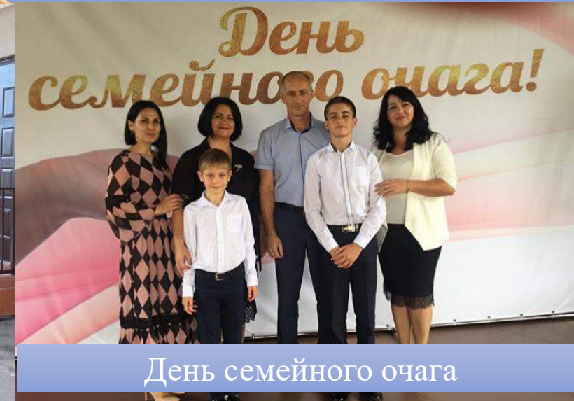
День семейного очага

В целях укрепления авторитета семьи, повышения значимости семейных ценностей отделение семьи, материнства и детства организует и проводит такие мероприятия, как День Семейного очага, День семьи, Семья года, День семьи, любви и верности, «Всей семьей на выходной»