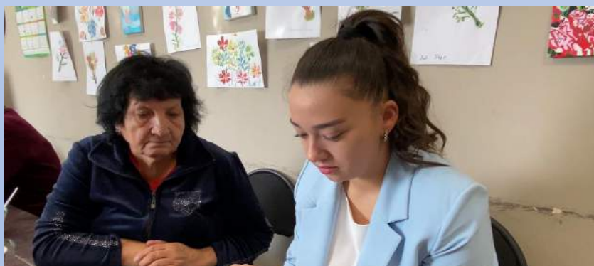
Компьютерное и Smart-обучение

Школа родственного ухода. В рамках развитие технологий «Школы родственного ухода» решаются задачи обучения родственников и других лиц, осуществляющих уход за пожилыми, маломобильными гражданами и инвалидами на дому методам самообслуживания и самоконтроля, использованию технических средств реабилитации, методам предотвращения или коррекции дезадаптивных состояний, возникающих у родственников инвалидов, информирование и консультирование родственников, осуществляющих уход, по вопросам реабилитации, информирование по осуществлению связей с другими учреждениями социальной службы.