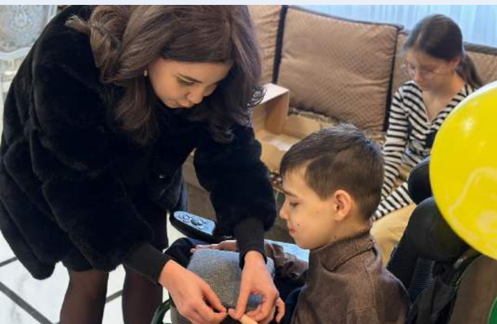
«Подари тепло ребенку»