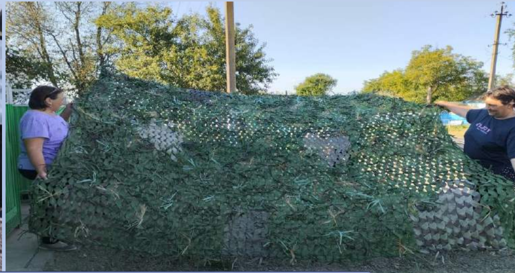
«Твори добро для ПОБЕДЫ»