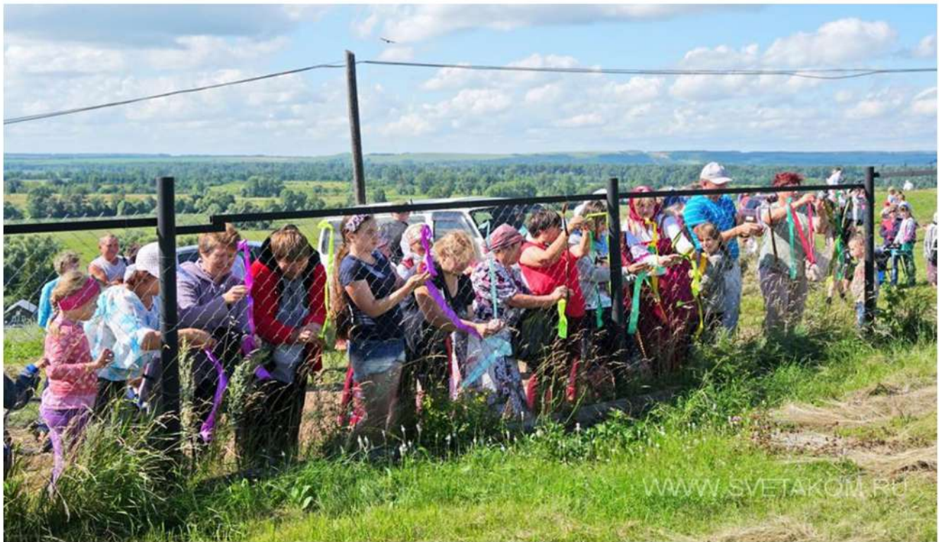
Совместное создание надписи из атласных ленточек «Живи, Деревня!» 6 августа 2017г

«С тех пор все наши усилия направлены на то, чтобы поддержать нынешнее его техническое состояние до того момента, когда найдутся инвесторы способные в сотрудничестве с митрополией воссоздать православную святыню. Для этого и стараемся проводить разного рода Акции, через средства массовой информации привлекая внимание людей.»