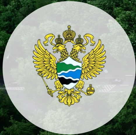
Министерство природных ресурсов и экологии Российской Федерации