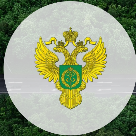
Федеральное агентство лесного хозяйства