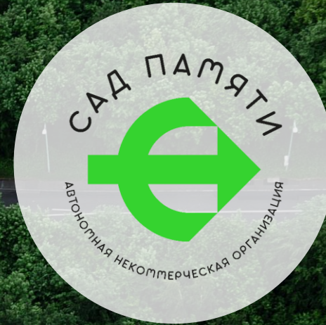
АНО «Сад Памяти»