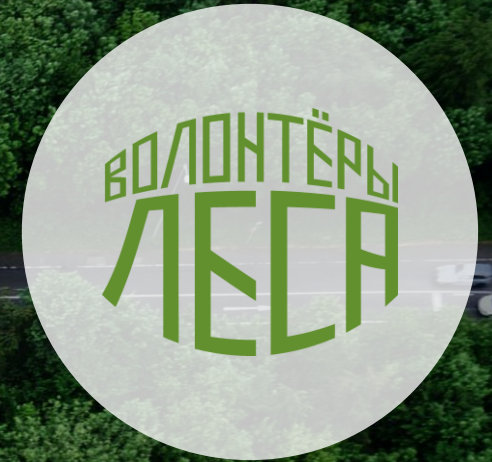
ВОД «Волонтеры Леса»