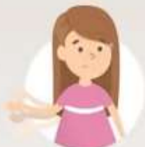
Расстройства развития двигательных функций