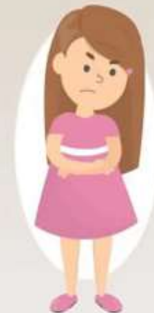
Эмоционально- лабильные расстройства