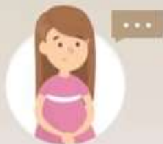
Расстройства формирования речи