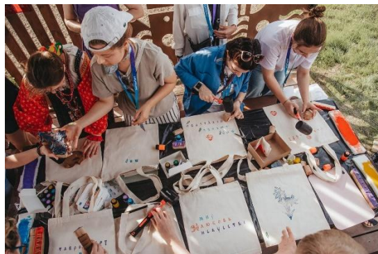
Набойка по ткани