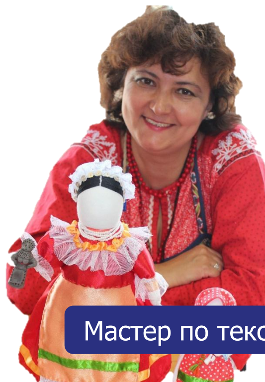
Мастер по текстилю