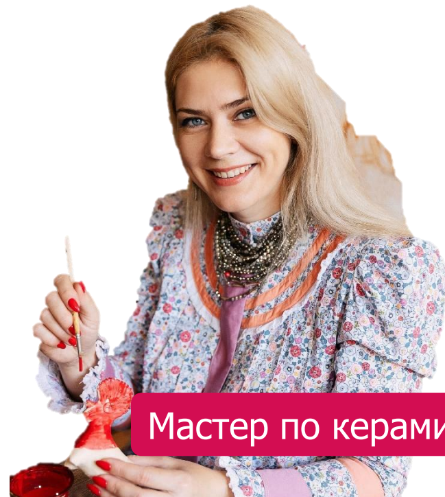
Мастер по керамике