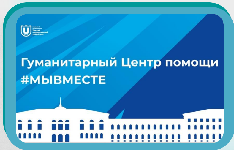
ЦЕНТР ГУМАНИТАРНОЙ ПОМОЩИ #МЫВМЕСТЕ ТГУ