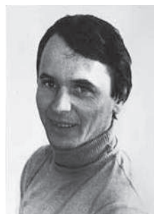
Он был одержим стремлением к совершенству

Самое смешное в этой ситуации – поразивший меня персонаж работал со мной в одной мастерской худфонда, гигантской по площади, в этой настоящей «коммуналке» где-то за занавеской он имел свою выгородку. Я даже слышала ше-