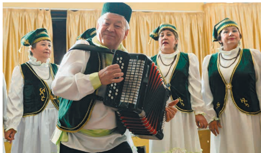
...и бойко руководит женскими коллективами