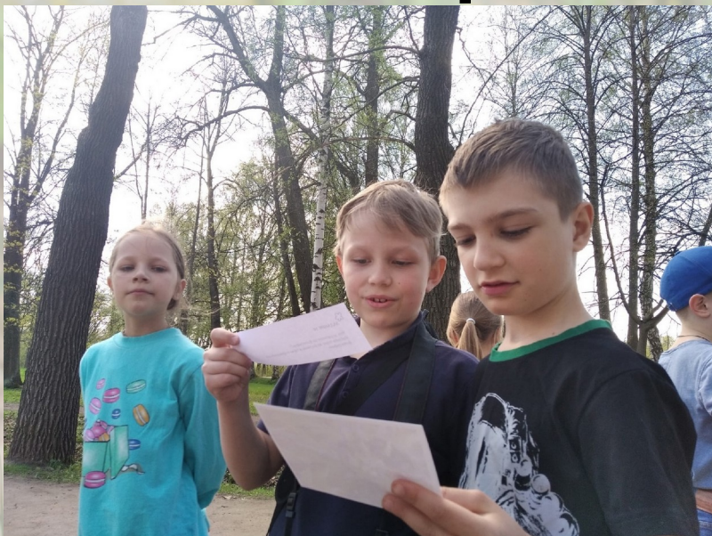
Фото-кросс в Нижнем парке