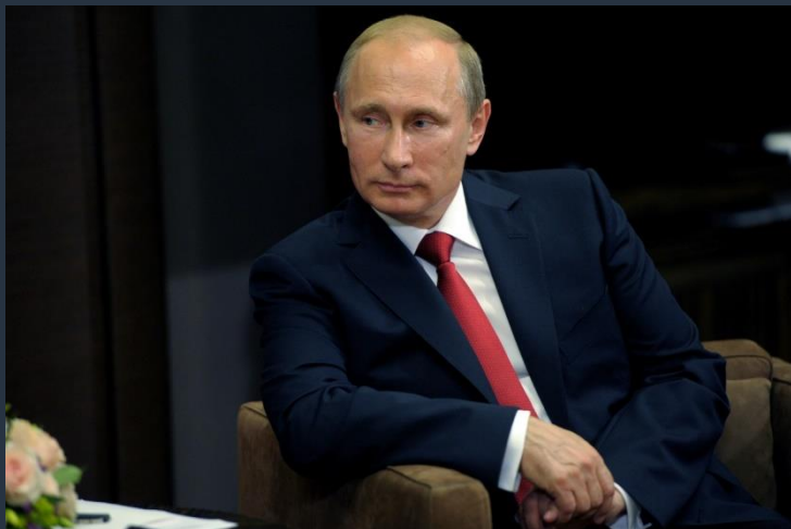
Президент Российской Федерации В. В. Путин

«Переход России к модели устойчивого развития, и не просто к модели устойчивого развития, а экологически устойчивого развития. Я хочу это подчеркнуть, мы говорим о развитии экономики страны, но с упором на решение экологических проблем».