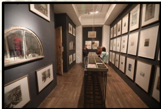
Зал временных выставок