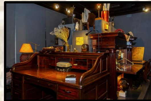
Экспозиция «Иосиф Бродский. Натюрморт»