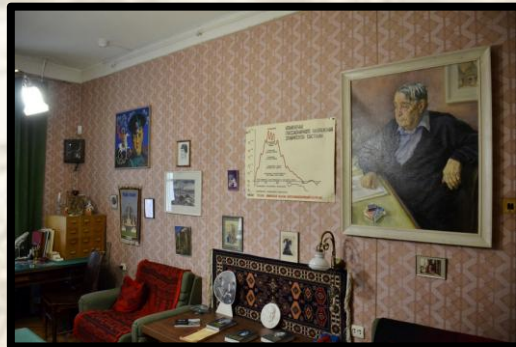
Мемориальная квартира Льва Гумилёва. Филиал Музея Анны Ахматовой