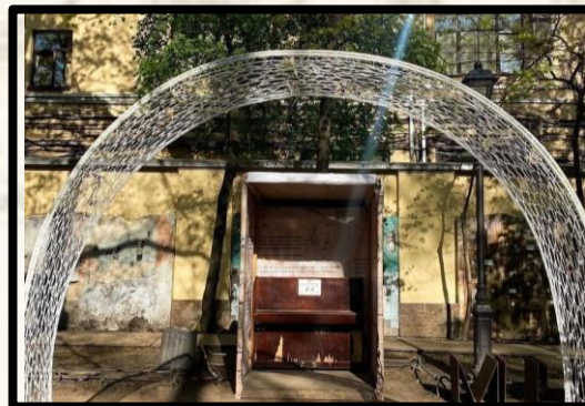
Сад Фонтанного Дома