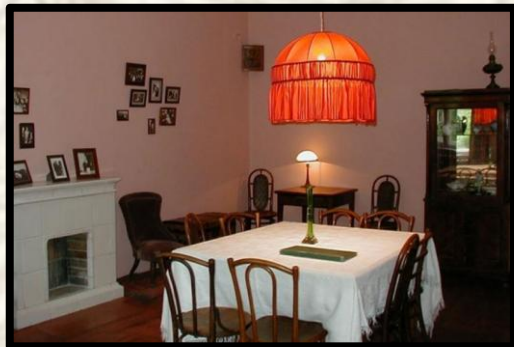
Мемориальная квартира Ахматовой-Пуниных