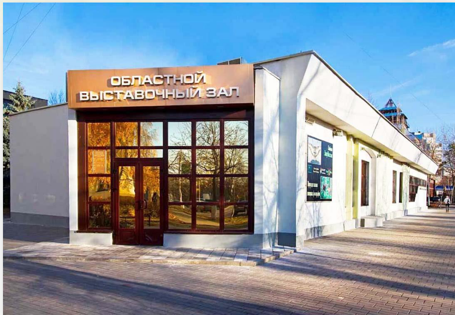
Областной выставочный зал