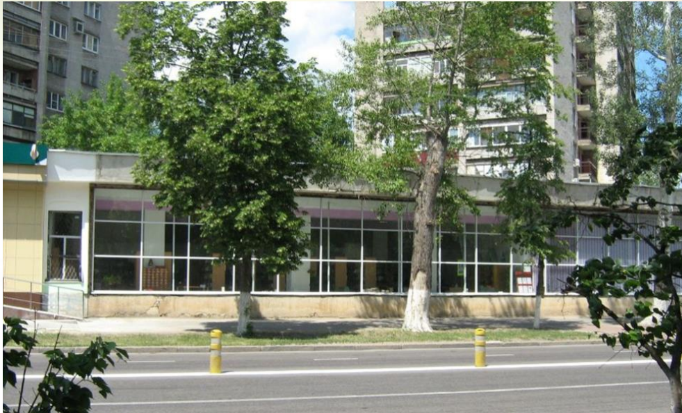
Библиотечно-информационный центр им. П.И. Бартенева