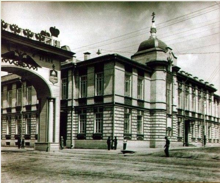
Дом аптекаря Вяжлинского 1910 год