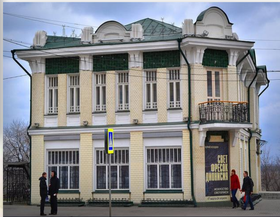
Художественный музей народного художника России В.С. Сорокина 2010 год