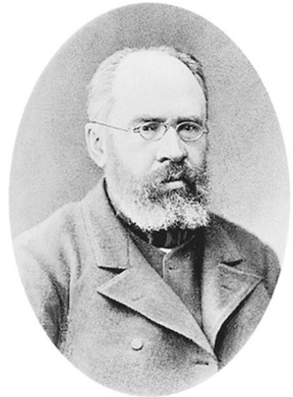
П.И. Бартенева (1829 – 1912г.г.) русский историк, литературовед, основатель пушкиноведения