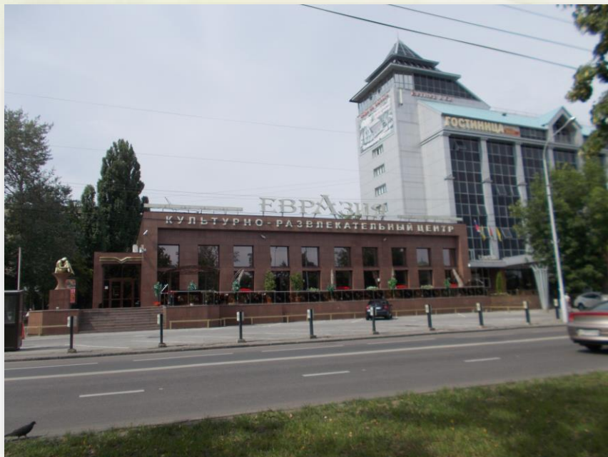
Культурно-развлекательный центр «Евразия»

Памятный знак М.Т Наролину (1933-2011 г.г.), Главе администрации Липецкой области (1993-1998 г.г.)