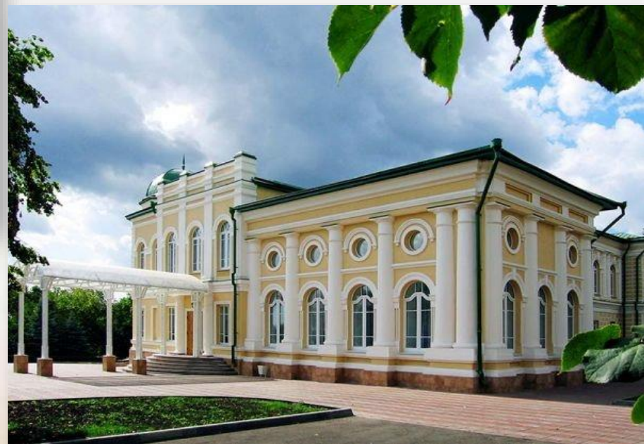
Дворец бракосочетания Историческое здание – дом купца Русинова