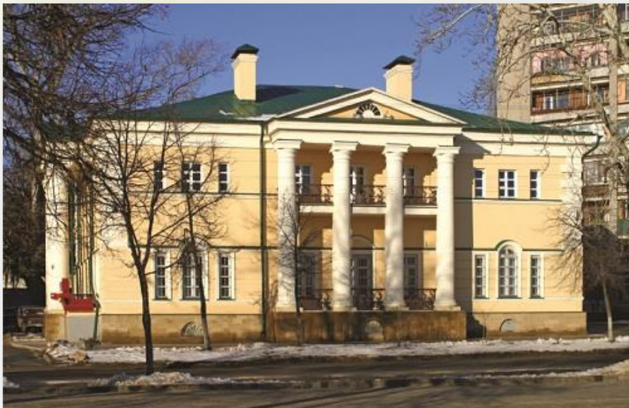
Липецкий областной художественный музей историческое здание дом генерала А.М Губина