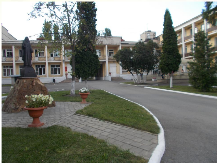
Областная больница № 2