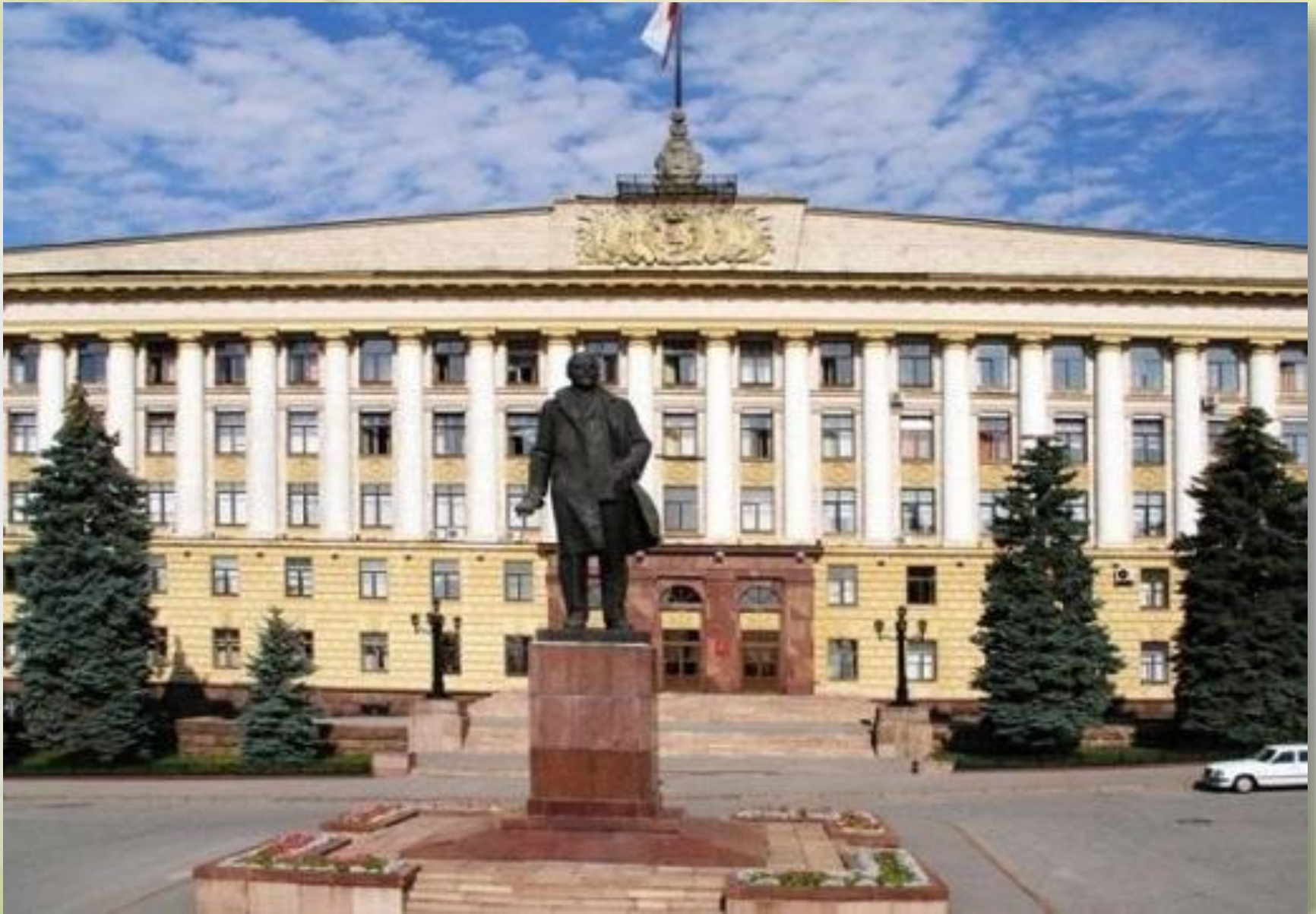
Памятник В.И. Ленину