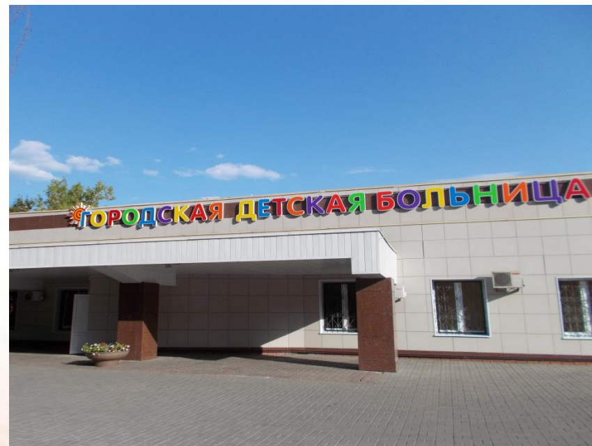
Городская детская больница