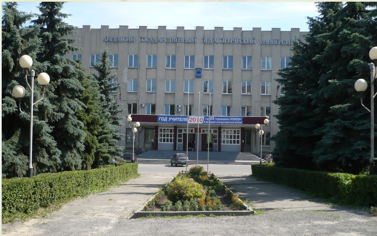
Липецкий государственный педагогический университет им П.П. Семёнова – Тян - Шанского