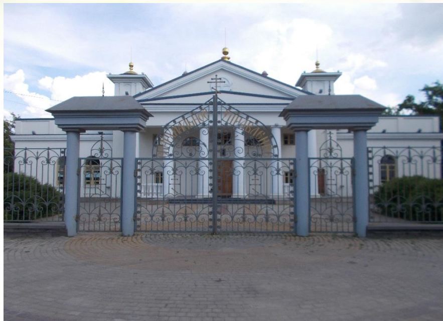
Липецкое епархиальное управление