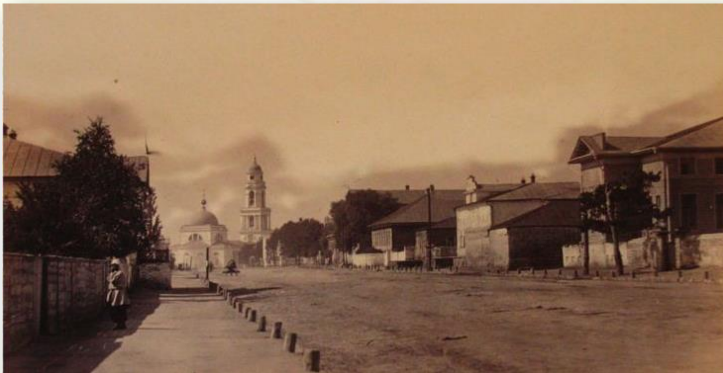
Перспектива улицы Дворянской с видом на Христорождественский собор, начало XX века