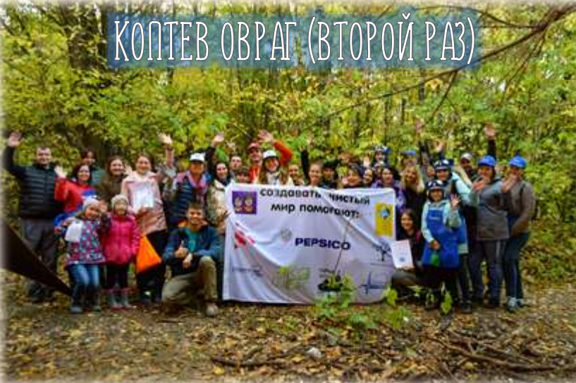
КОПТЕВ ОВРАГ (ВТОРОЙ РАЗ)