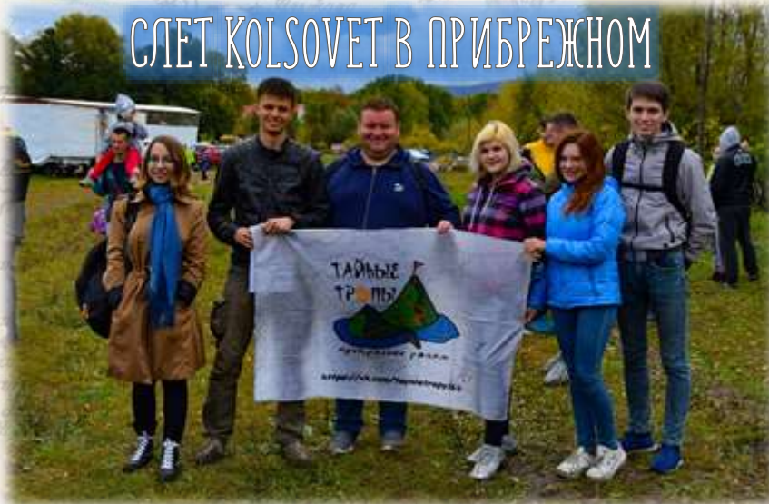
СЛЕТ KOLSOVET В ПРИБРЕЖНОМ