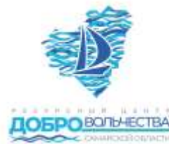
РЕСУРСНЫЙ ЦЕНТР ДОБРОВОЛЬЧЕСТВА СО