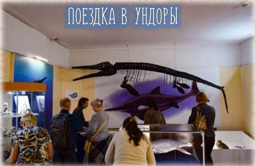
ПОЕЗДКА В УНДОРЫ