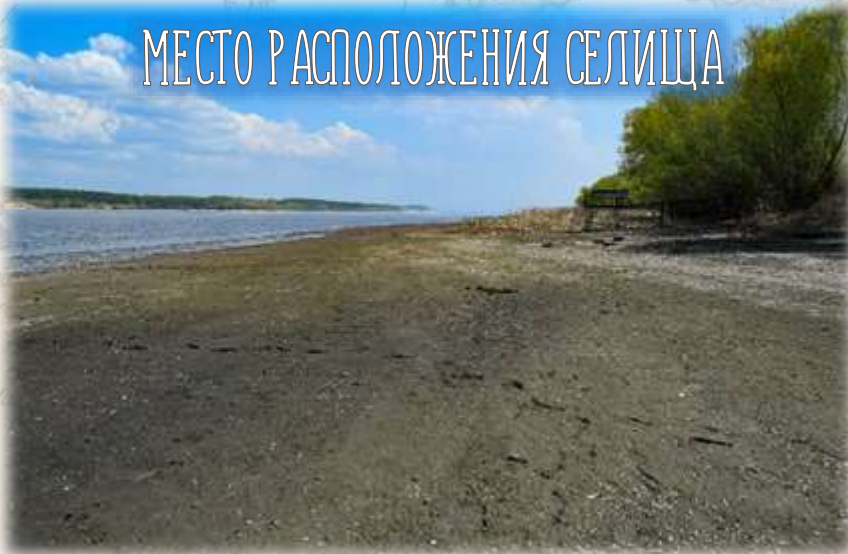
МЕСТО РАСПОЛОЖЕНИЯ СЕЛИЩА