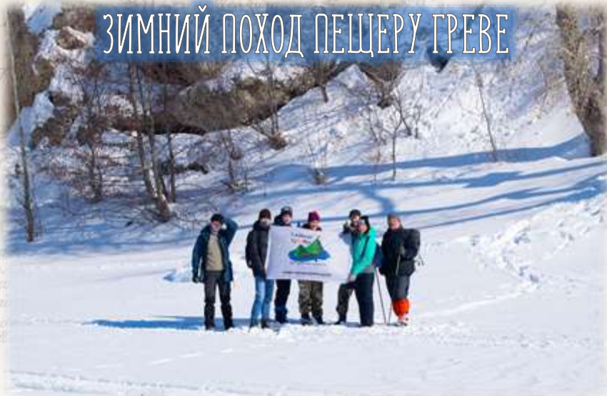
ЗИМНИЙ ПОХОД ПЕЩЕРУ ГРЕВЕ