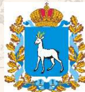
МИНИСТЕРСТВО ЛЕСНОГО ХОЗЯЙСТВА, ОХРАНЫ ОКРУЖАЮЩЕЙ РЕДЫ И ПРИРОДОПОЛЬЗОВАНИЯ СО