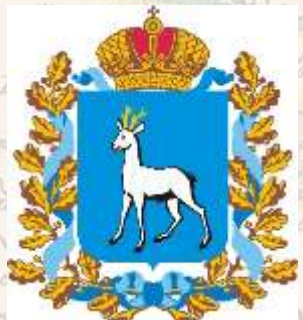
ДЕПАРТАМЕНТ ПО ДЕЛАМ МОЛОДЕЖИ МИНОБРНАУКИ СО