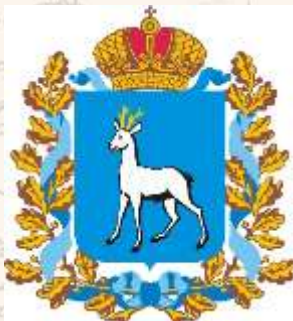
АДМИНИСТРАЦИЯ КРАСНОГЛИНСКОГО РАЙОНА САМАРЫ