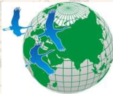
СОЦИАЛЬНО- ЭКОЛОГИЧЕСКИЙ СОЮЗ ТОЛЬЯТТИ