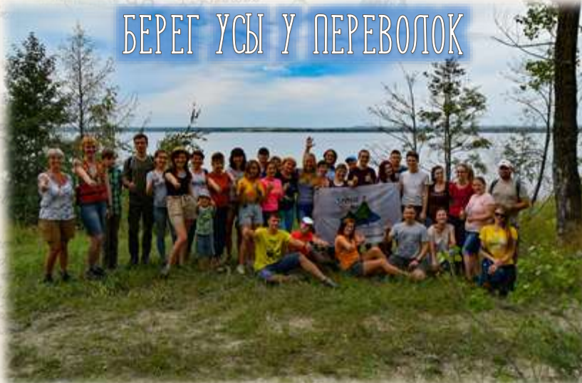
БЕРЕГ УСЫ У ПЕРЕВОЛОК