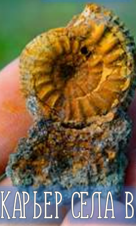
КАРЬЕР СЕЛА ВАЛЫ