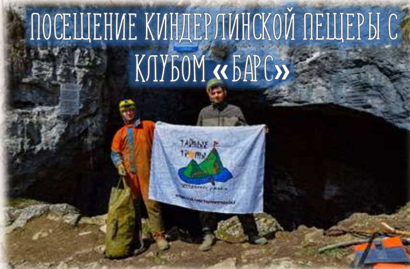
ПОСЕЩЕНИЕ КИНДЕРЛИНСКОЙ ПЕЩЕРЫ С КЛУБОМ «БАРС»