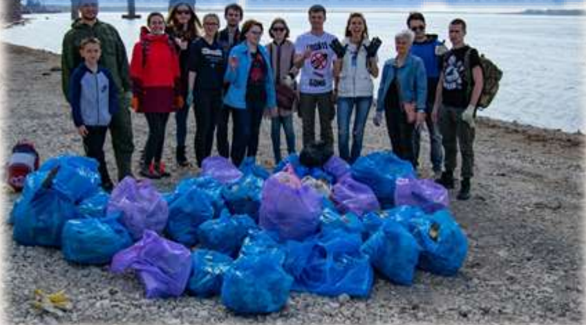
СУББОТНИК НА 6-М ПРИЧАТЕ С «ЭКОШОК»