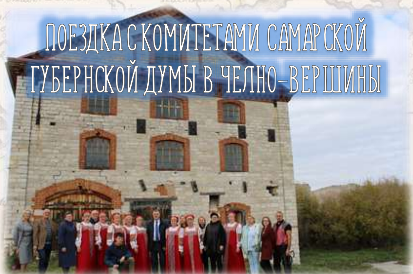
ПОЕЗДКА С КОМИТЕТАМИ САМАРСКОЙ ГУБЕРНСКОЙ ДУМЫ В ЧЕЛНО-ВЕРШИНЫ