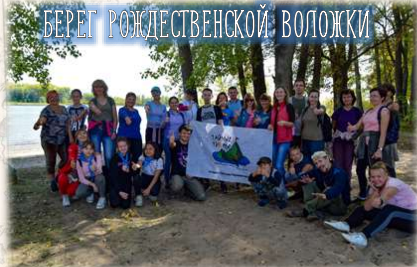
БЕРЕГ РОЖДЕСТВЕНСКОЙ ВОЛОЖКИ