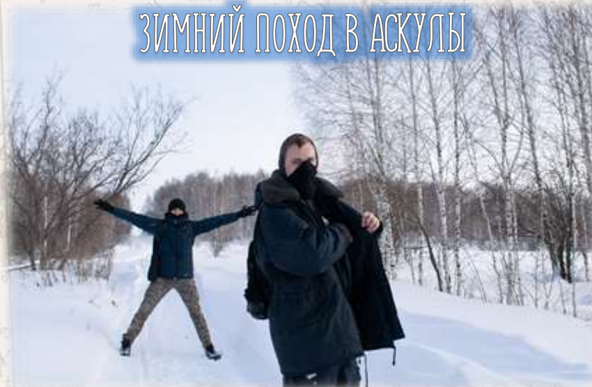
ЗИМНИЙ ПОХОД В АСКУЛЫ