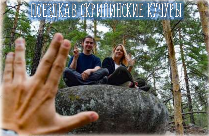
ПОЕЗДКА В СКРИПИНСКИЕ КУЧУРЫ