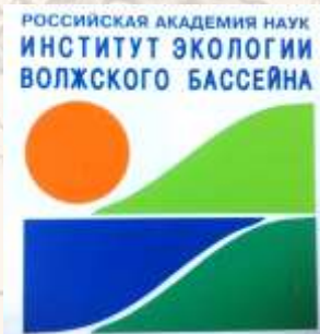
ИНСТИТУТ ЭКОЛОГИИ ВОЛЖСКОГО БАСЕЙНА