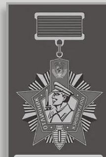
ХРОО "Ветераны пограничной службы" ХАКАСИЯ