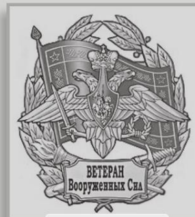
РО ООВВ Вооруженных сил Российской Федерации ХАКАСИЯ