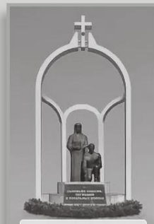
Комитет "Родительский набат" ХАКАСИЯ

ХРО ВООВ "БОЕВОЕ БРАТСТВО" - объединяет сайты ветеранов Хакасии