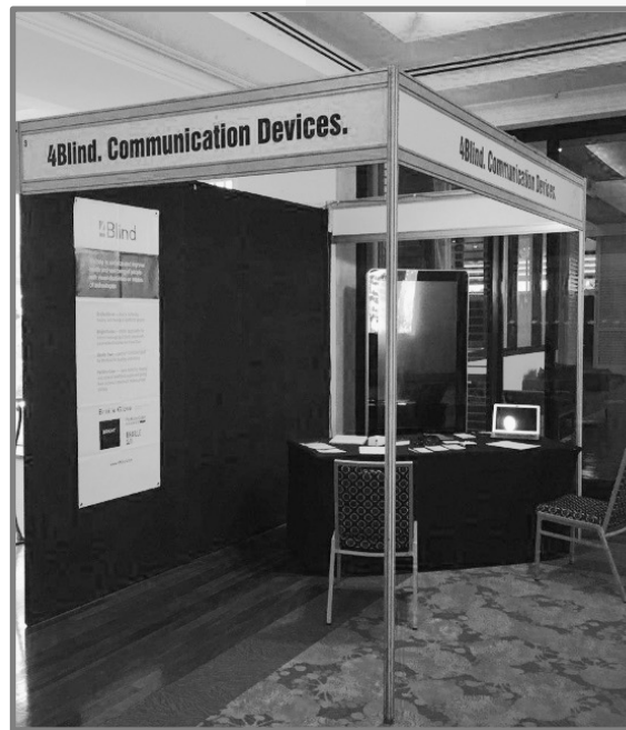
Фото с конференции в Австралии 2019 г.