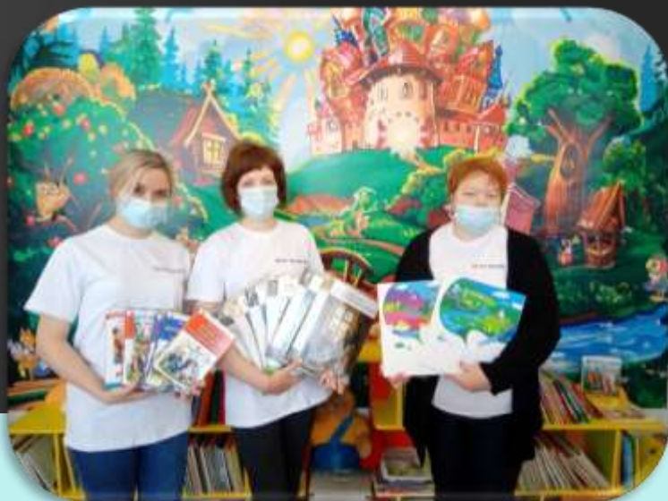
Общероссийская акция «Дарите книги с любовью»