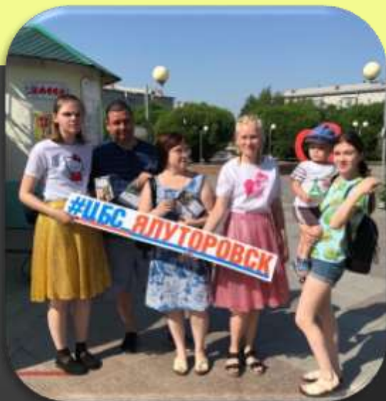
Рекламная акция «А вы знаете, как пройти в библиотеку?!»

Активно отражается работа в верифицированном личном кабинете портала Добровольцы России.