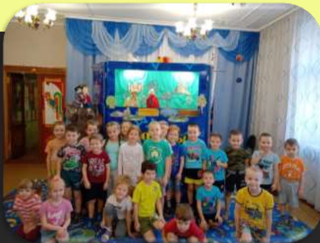
Кукольные спектакли в детских садах города