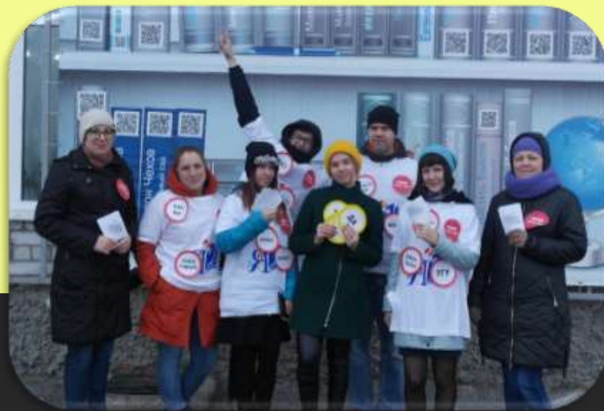
Акция «Чисто слово в каждый дом»