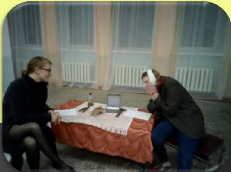
Литературная театрализованная постановка «Добрый юмор А.П. Чехова»