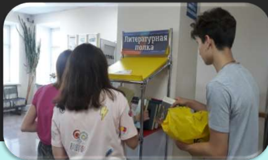
Обслуживание литературных полок в общественных местах города