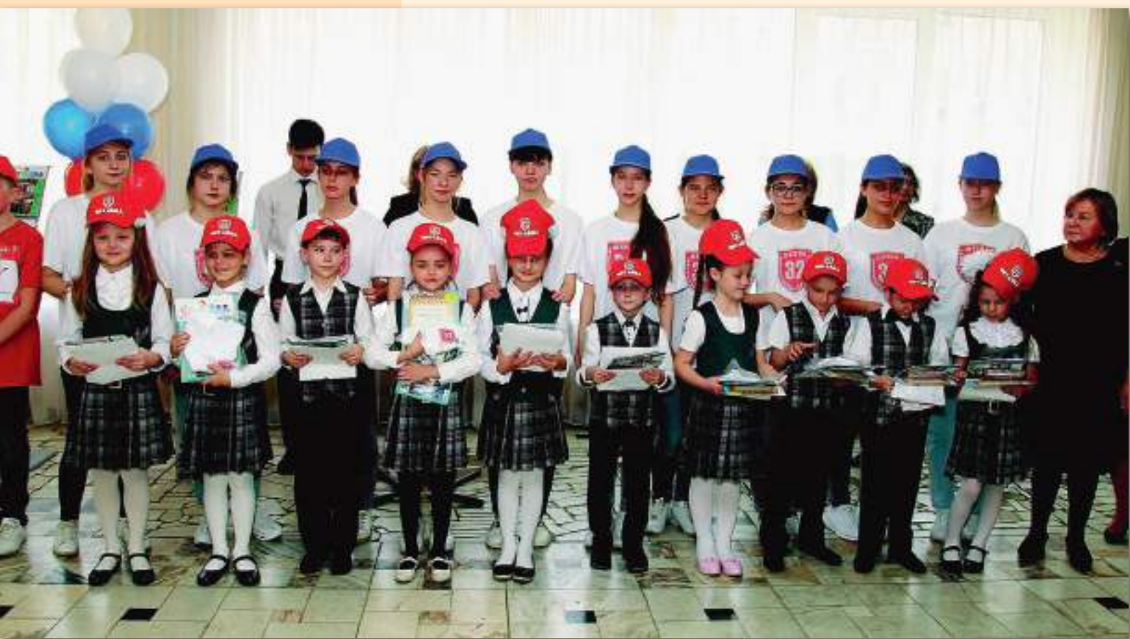
Праздник «Букваря» – посвящение в Читайки. Первые классы МБОУ СОШ № 32, г. Краснодар