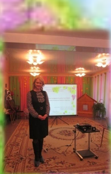
МДОУ «Детский сад №109 «Изюминка» г. Ярославль

Межрегиональная научно-практическая конференция «Доступная среда для детей с ограниченными возможностями здоровья: проблемы инклюзивного образования» г.Ярославль