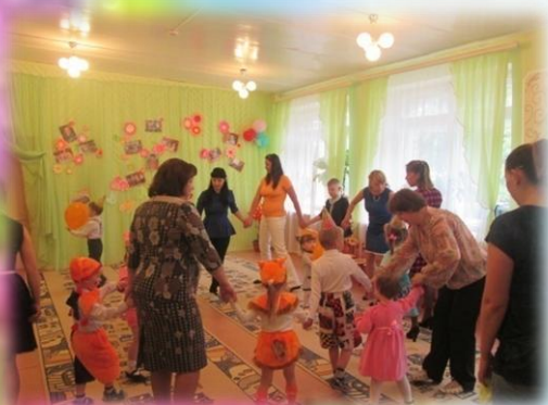
День рождения группы «Особый ребёнок»