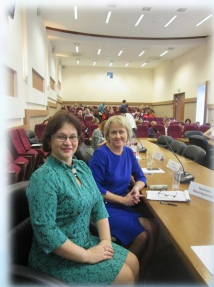
Семинар «Итоги апробации примерных образовательных программ физической культуры для инвалидов и лиц с ограниченными возможностями здоровья с использованием средств адаптивной физической культуры и адаптивного спорта»