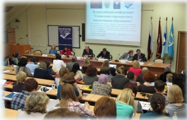
Всероссийская конференция «Социальное партнёрство в инклюзивном образовании» г. Москва