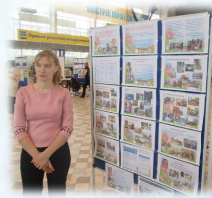
XV международная ярмарка социально-педагогических инноваций п. Отрадный, Самарской области