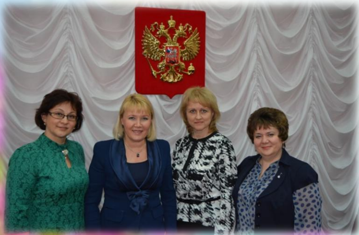
Второй Всероссийский форум «Воспитатели России» г. Москва