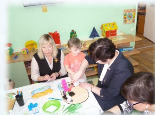
Визит уполномоченного по правам ребёнка при губернаторе Костромской области