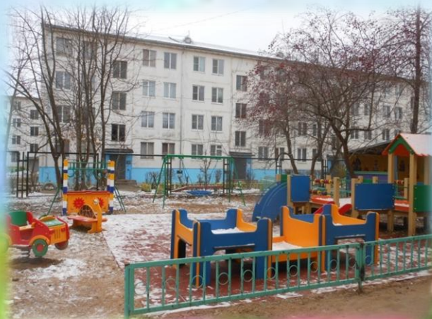
Участок для детей с инвалидностью