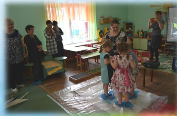
Семинар для педагогов города «Волшебный мир здоровья»