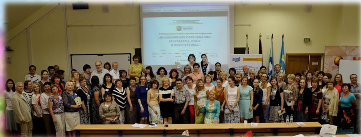
III международная научно-практическая конференция «Инклюзивное образование: результаты, опыт и перспективы»