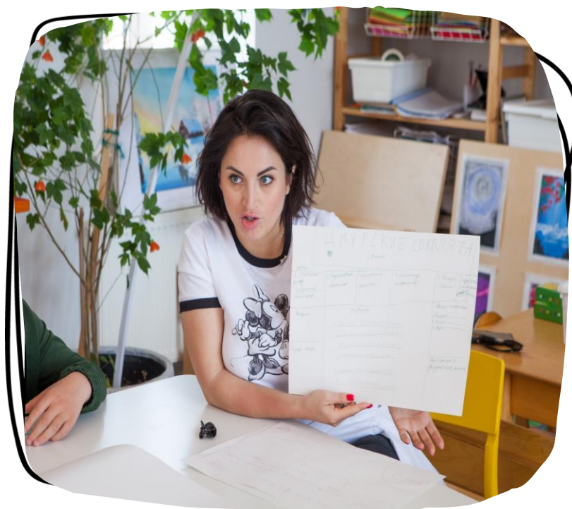
Подготовка к школе