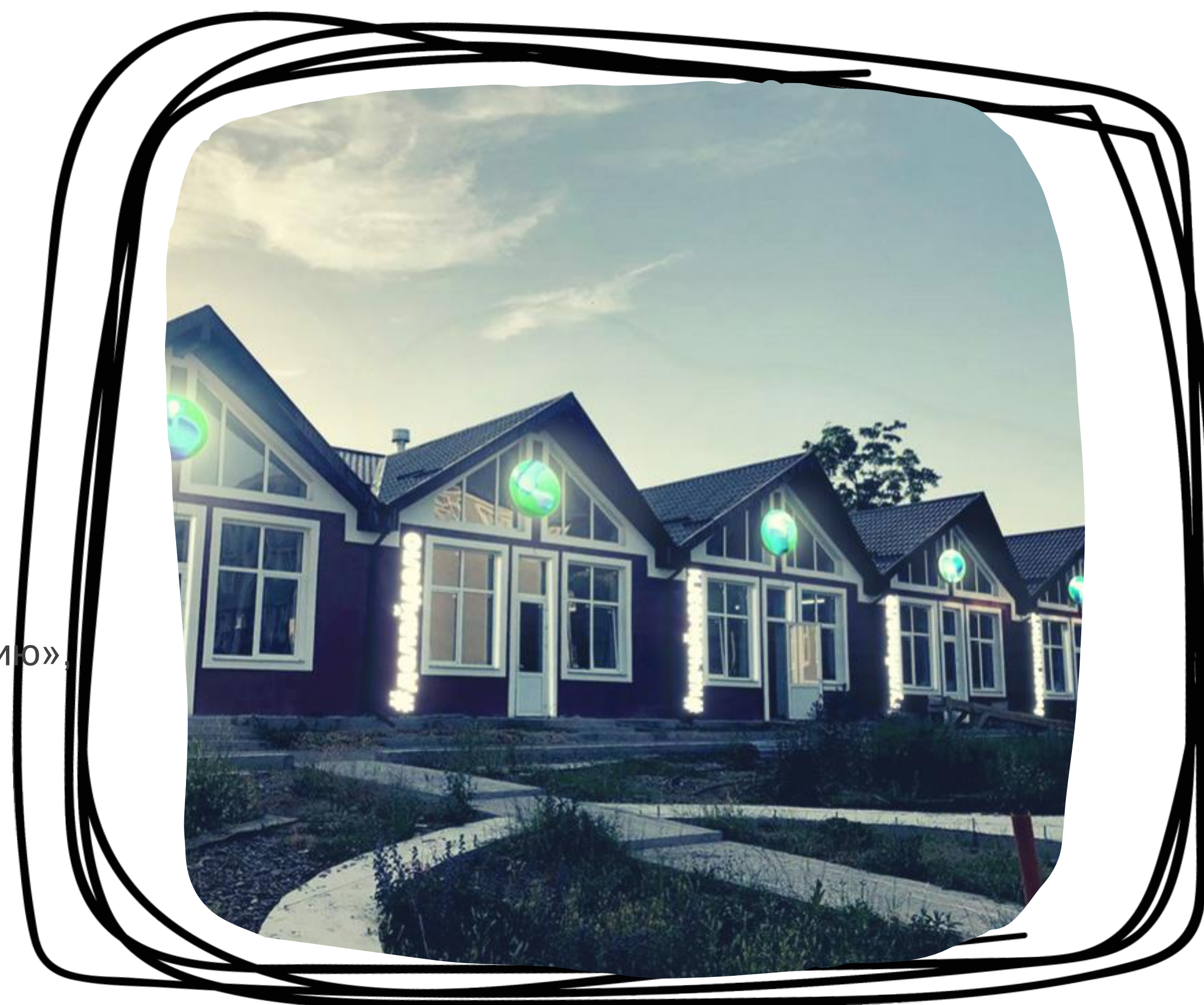
Мастерские для дополнительного образования