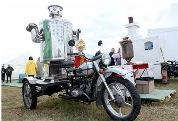
Раритетный мотоцикл «Урал» (Экспозиция Свердловской области)