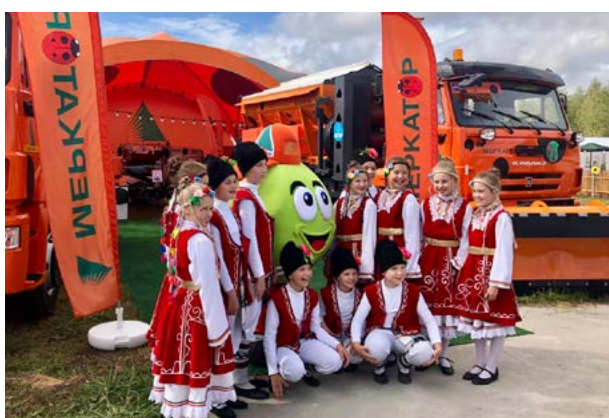
«Меркатор Холдинг» выставка коммунальной техники