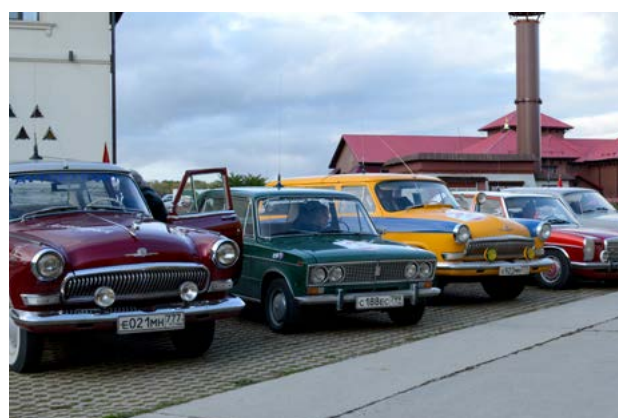
Раритетные автомобили советского периода