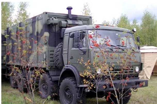
Мобильный передвижной хлебозавод Министерства обороны