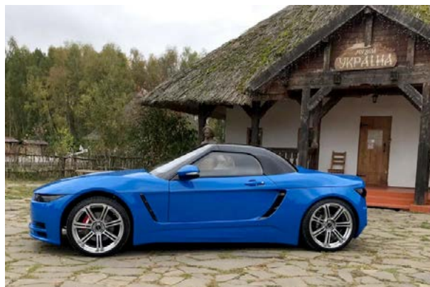
Отечественный родстер «Крым» созданный студентами