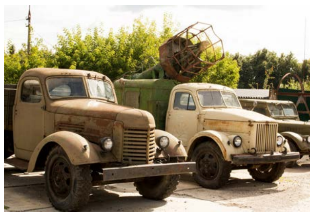
Музей техники Вадима Задорожного