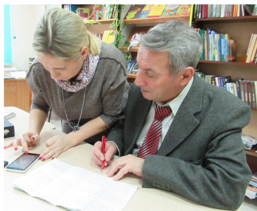
Мобильные устройства – на службу пенсионерам!

Партнерство с ветеранами продолжилось в ходе реализации другого социально значимого проекта « Ветеран ONLINE ». Он стал логическим продолжением предыдущего. Направлен Чебоксарской городской общественной организацией ветеранов (пенсионеров) войны, труда, Вооруженных сил и правоохранительных органов на конкурс проектов для предоставления субсидий на конкурсной основе за счет средств республиканского бюджета Чувашской Республики и средств, поступивших в республиканский бюджет Чувашской Республики из федерального бюджета, социально ориентированным некоммерческим организациям и в 2018 году признан победителем.