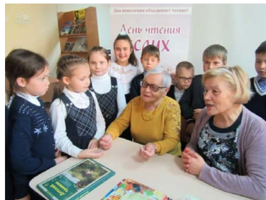
Члены клуба «Старость, отодвинься!» читают детям

Широкому вовлечению в реализацию проекта людей старшего поколения способствовала республиканская акция «День чтения вслух». Она стала для детей и подростков настоящим праздником чтения, полным событий, встреч и приятных мгновений общения с творчеством лучших писателей и поэтов, их книгами и литературными героями. Участниками акции стали более 2 тысяч человек. В их числе – представители ветеранских организаций и члены клуба «Старость, отодвинься!», дети, подростки, педагоги, воспитатели детских дошкольных учреждений, специалисты муниципальных и государственных библиотек Чувашской Республики. Во время праздника книги каждый желающий смог испытать себя в искусстве чтения вслух или просто послушать читающих. Мамы и папы, бабушки и дедушки, писатели и педагоги, члены городской общественной организации ветеранов (пенсионеров) войны, труда, Вооруженных сил и правоохранительных органов, волонтеры и библиотекари читали и рассказывали о детских книгах