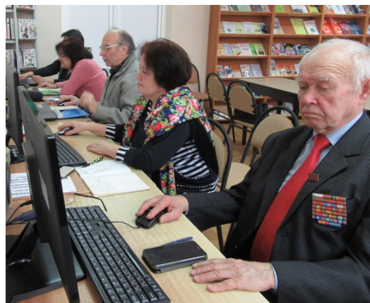
«Курсанты» - участники занятий по виртуальному туризму

Для решения этой задачи был заключен договор, начался набор первых групп «курсантов». Организационное заседание с участием желающих пройти обучение выявило низкий уровень их компьютерной грамотности. Поэтому первоначальная программа обучающих компьютерных занятий для ветеранов по виртуальному туризму, включающая виртуальные путешествия по городам и памятным местам России, была дополнена такими темами, как «Компьютер. Основные понятия», «Основы работы с Интернет-браузером», «Навыки поиска информации в Интернете», «Безопасная работа в Интернете», «Общение в Интернете: электронная почта, скайп, социальные сети», «Основы работы с текстовыми редакторами». По просьбе обучающихся в программу вошли также темы «Приобретение электронных билетов, регистрация на рейсы», «Медицинские и юридические консультации через Интернет». Затем начались обучающие индивидуальные занятия. Их проводили специалисты информационно-библиографического отдела библиотеки.