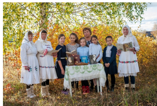
Участники Вурнарского района Чувашии – участники республиканской акции «День чтения вслух»

так, что у слушателей захватывало дух. Участники тематического дня читали по ролям, читали по очереди, читали, используя элементы театрализации и кукольных представлений. Кроме этого, чтение вслух сопровождали мультимедийные презентации, литературные игры, викторины, конкурсы, загадки, песни, книжные выставки, просмотры мультфильмов и творческие задания.