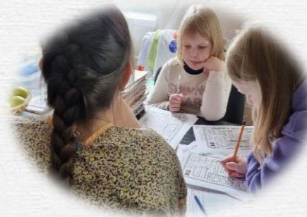
Помощь детям в обучении