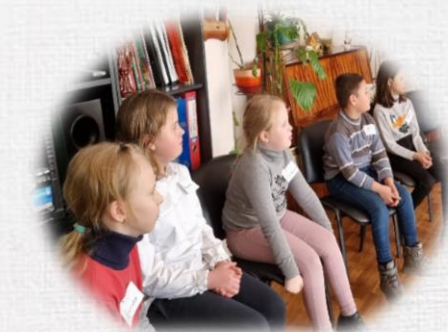
Детские игровые сессии