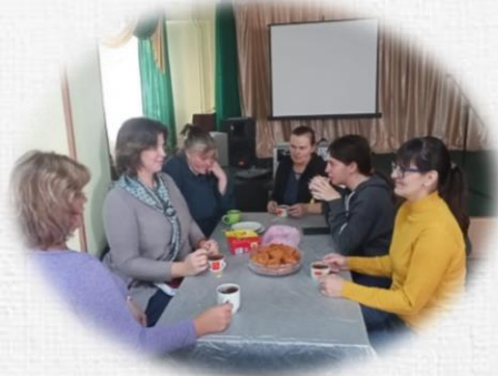
Группы общения опекаемых