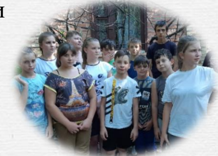
Помощь в лечении и оздоровлении