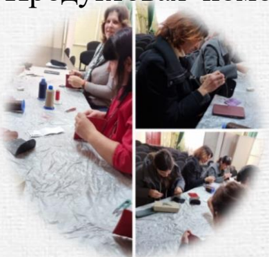
Мастер-классы для мам