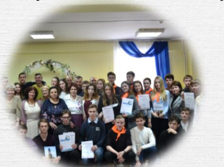
Реализация Просветительских программ