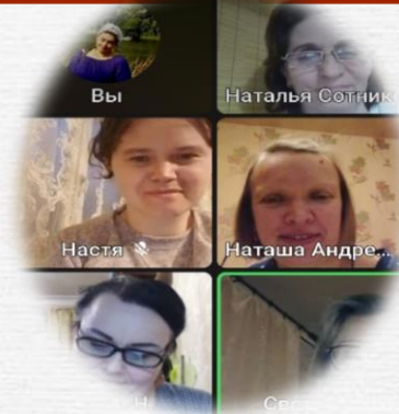
группы поддержки онлайн