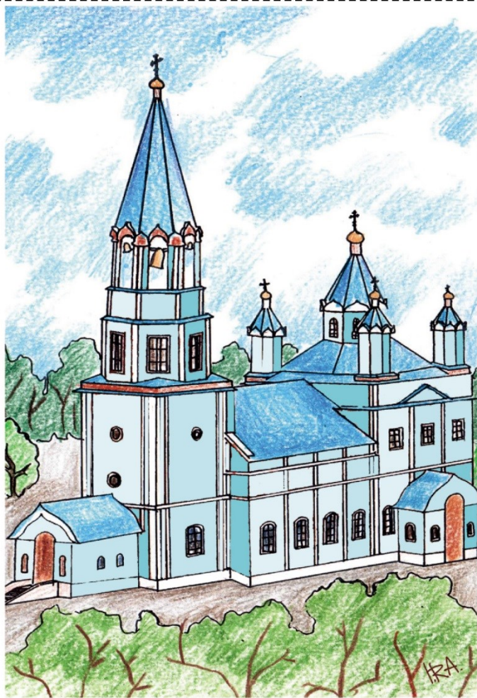
Богородско - Уфимский храм (1990 г.)