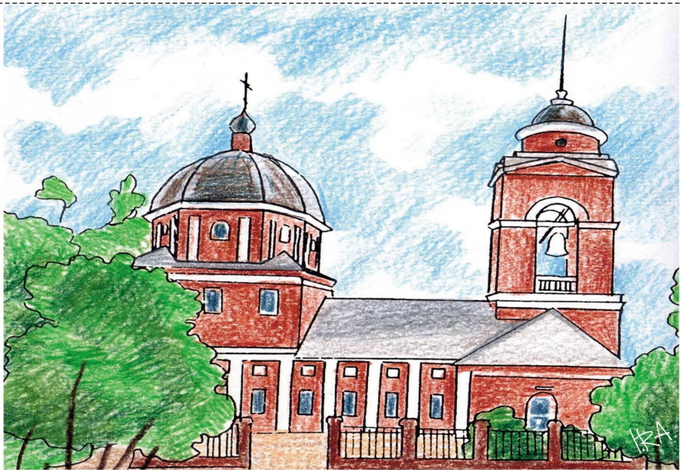
Покровский храм (1817 г.)