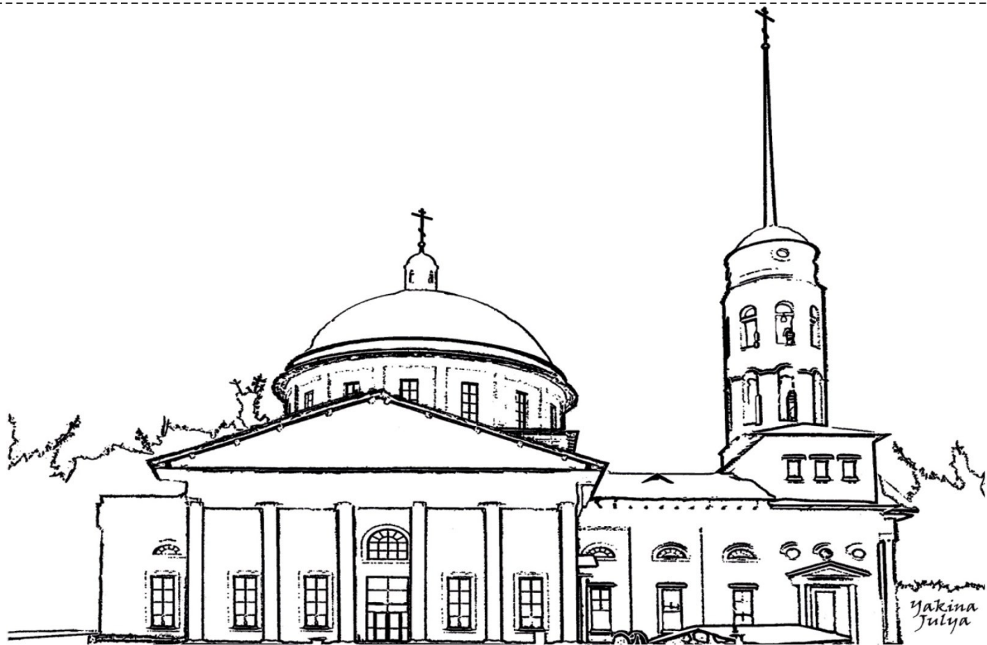
Воскресенский Собор Воскресения Христова (2003г.)