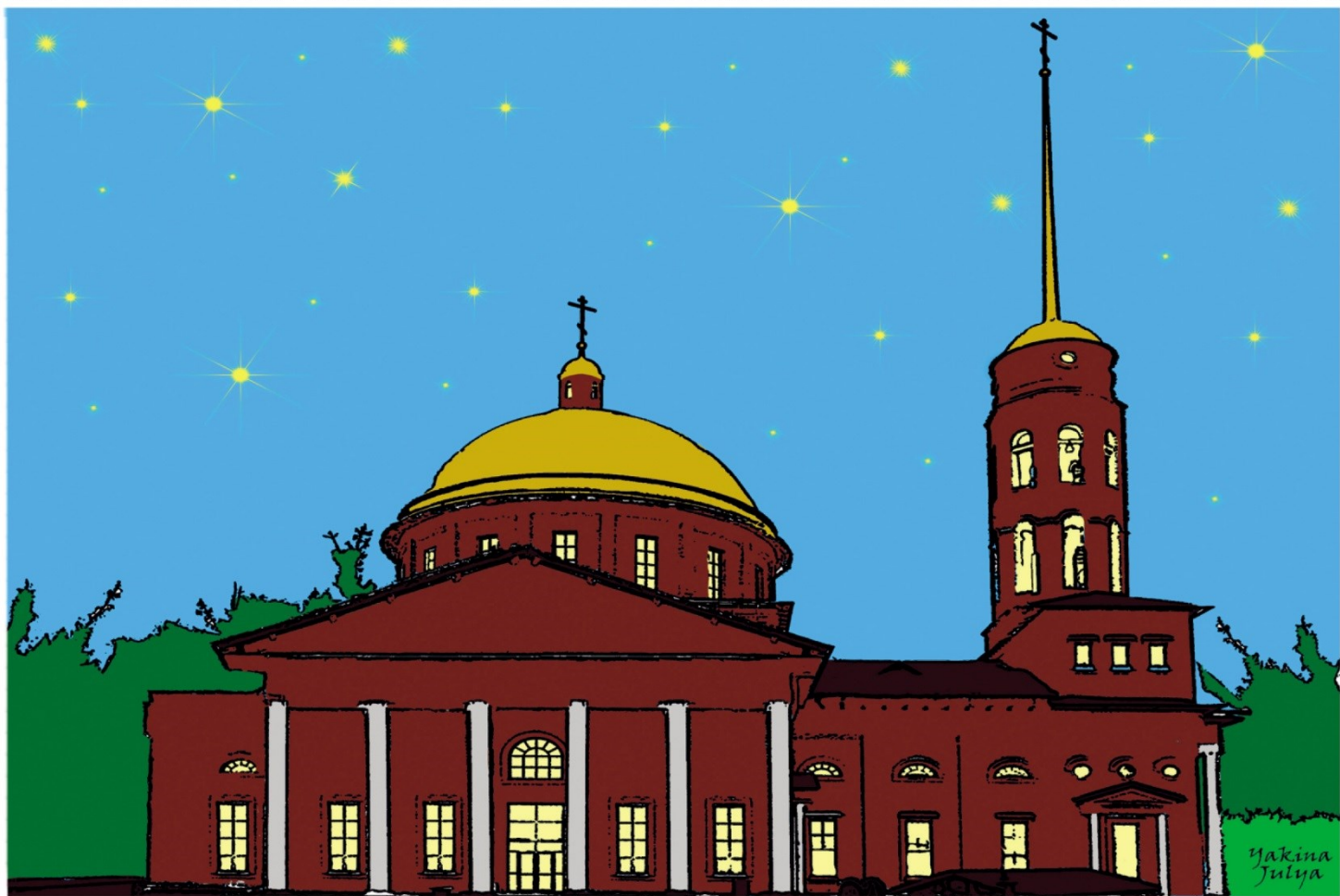
Воскресенский Собор Воскресения Христова (2003г.)