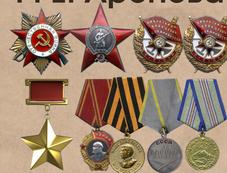
Р. Е. Аронова

Награждена: Герой Советского Союза, орден Ленина, орден Красного Знамени, орден Отечественной войны I степени, орден Красной Звезды, медаль «За оборону Кавказа», медаль «За победу над Германией в Великой Отечественной войне 1941–1945 гг.»