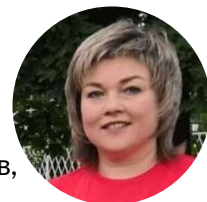
Автор проекта: Калинина Елена