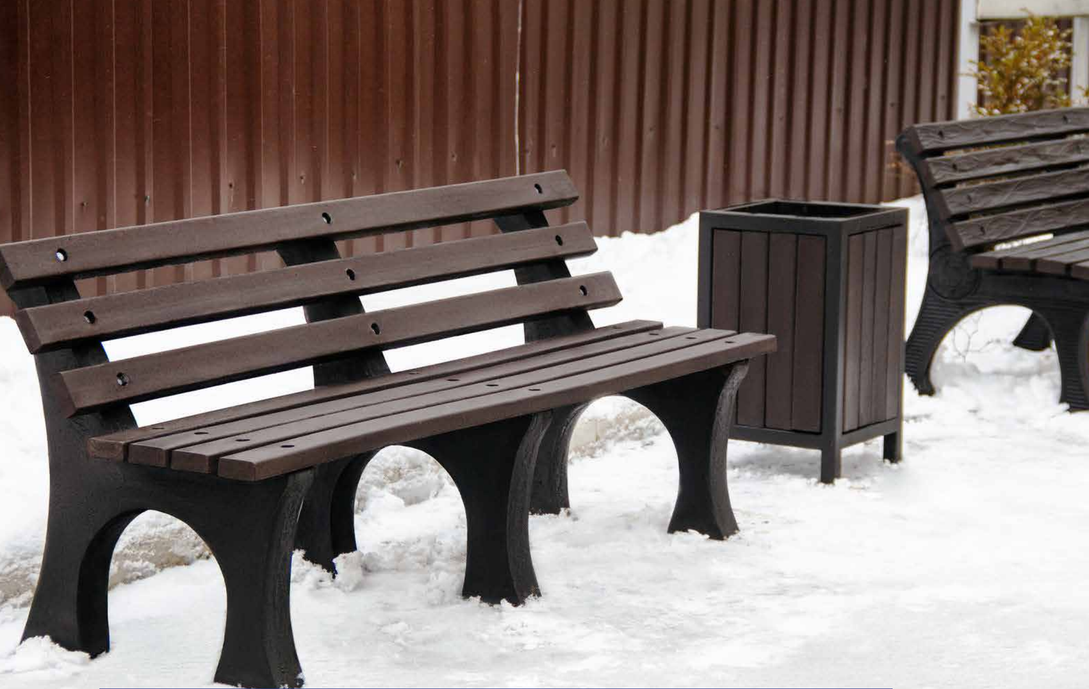
Предполагаемый вид лавочек из переработанного пластика