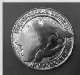
Знак «Доброволец Новгородской области»

Волонтерство в сфере культуры сейчас является одним из основных направлений развития добровольчества в России. На протяжении последних лет при поддержке государства это направление активно позиционировалось, привлекая органы государственной власти в сфере молодежной политики поддерживать и помогать подобным инициативам.