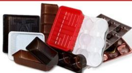
ПЭТ-коррекс цветной БЕЗ ЭТИКЕТОК!