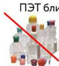
ПЭТ (01) от бытовой химии, шампуней