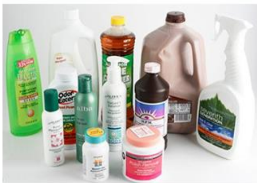
Бутылки и банки от бытовой химии, шампуня, моющих средств и т.д. СНЯТЬ ТЕРМОУСАДОЧНУЮ ПЛЕНКУ

ВСЕ БУТЫЛКИ НУЖНО СМЯТЬ. КРЫШКИ СДАВАТЬ ОТДЕЛЬНО