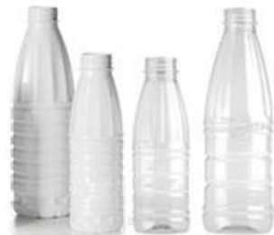
ПЭТ-бутылки от молочной продукции (прозрачные, белые)