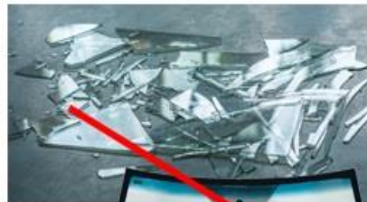
Листовое (оконное, от машин)