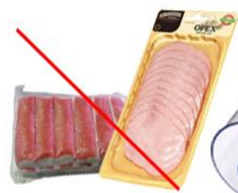
Упаковка от крабовых палочек и мясной нарезки