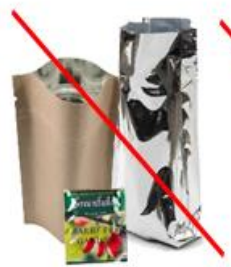
Любая упаковка с фольгированным слоем внутри