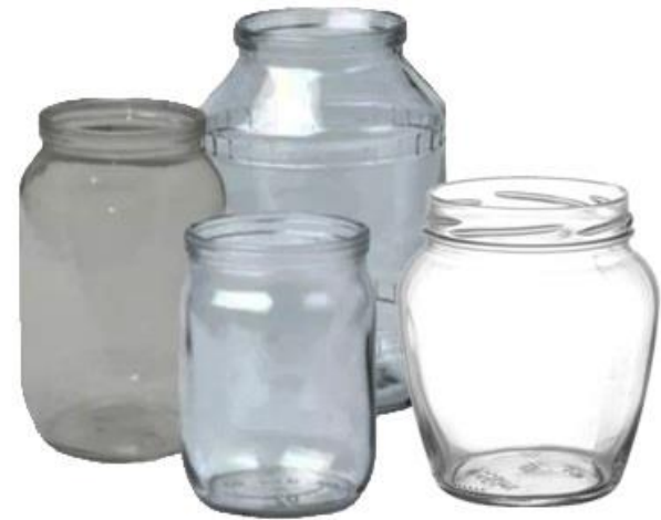
Банки прозрачные для консервации от 700 мл