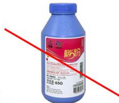
Тара без маркировки или 3, 7, PVC, OTHER