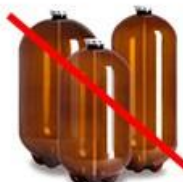
ПЭТ-кеги от пива