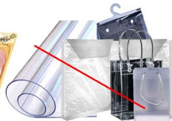
ПВХ пакеты и пленка