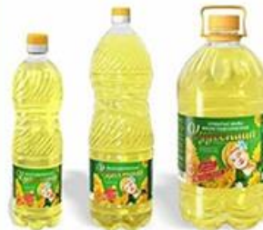
ПЭТ-бутылки от масла