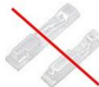
ПЭТ (01) от зубных щеток