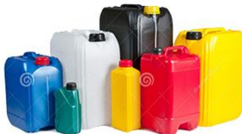
Пластиковые канистры от бытовой химии, масла, напитков