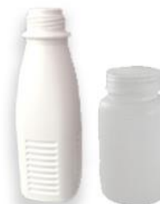
Бутылки от молочной продукции, баночки от йогурта, лекарств СНЯТЬ ТЕРМОУСАДОЧНУЮ ПЛЕНКУ