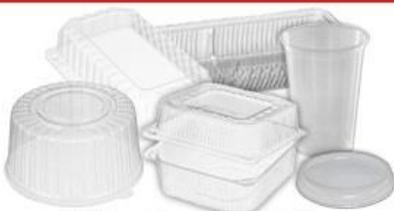
ПЭТ-коррекс (коробки) прозрачный БЕЗ ЭТИКЕТОК!