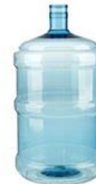
ПЭТ бутылки 18,9л от воды