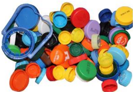
“Добрые крышечки” Проверить маркировку! Желательно сдавать в твердой таре