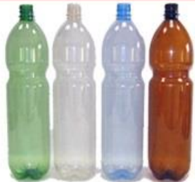
ПЭТ-бутылки от воды, газировки, пива (прозрачные, голубые, зеленые, коричневые)

ВСЕ БУТЫЛКИ НУЖНО СМЯТЬ. Крышки ЖЕЛАТЕЛЬНО сдавать отдельно. Наличие крышек переработке не мешает.