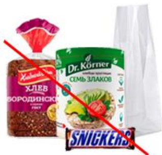
Пакеты 5 PP, принимается в своей фракции