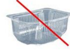
Упаковка без маркировки