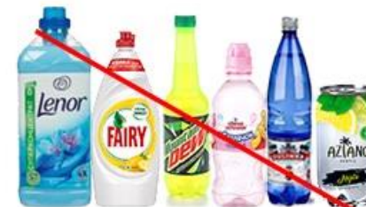
ПЭТ от FAIRY, Lenor, AZIANO, кислотного, розового, темно-синего, черного цвета