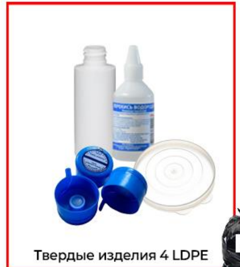
Твердые изделия 4 LDPE