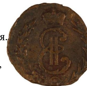
Монета сибирская. Деньга. 1779 г. (ХМ-2455. Н-725, коллекция «Нумизматика»