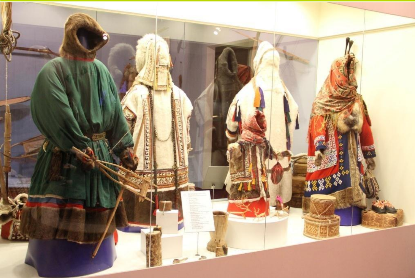
Экспозиция «Мифологическое время» (Игра)