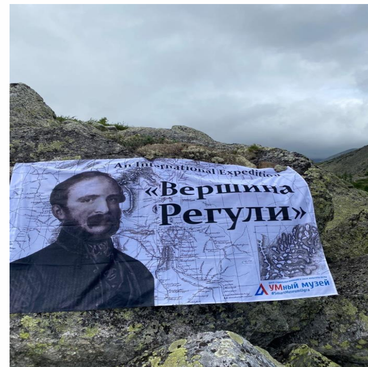
В горах Приполярного Урала. Экспедиция Музея Природы и Человека.