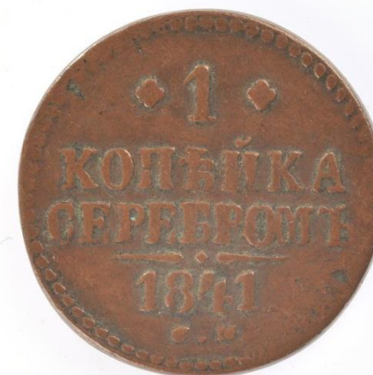
Монета разменная. 1 копейка серебром. 1841 г. (ХМ-1861/2. Н-376, коллекция «Нумизматика»