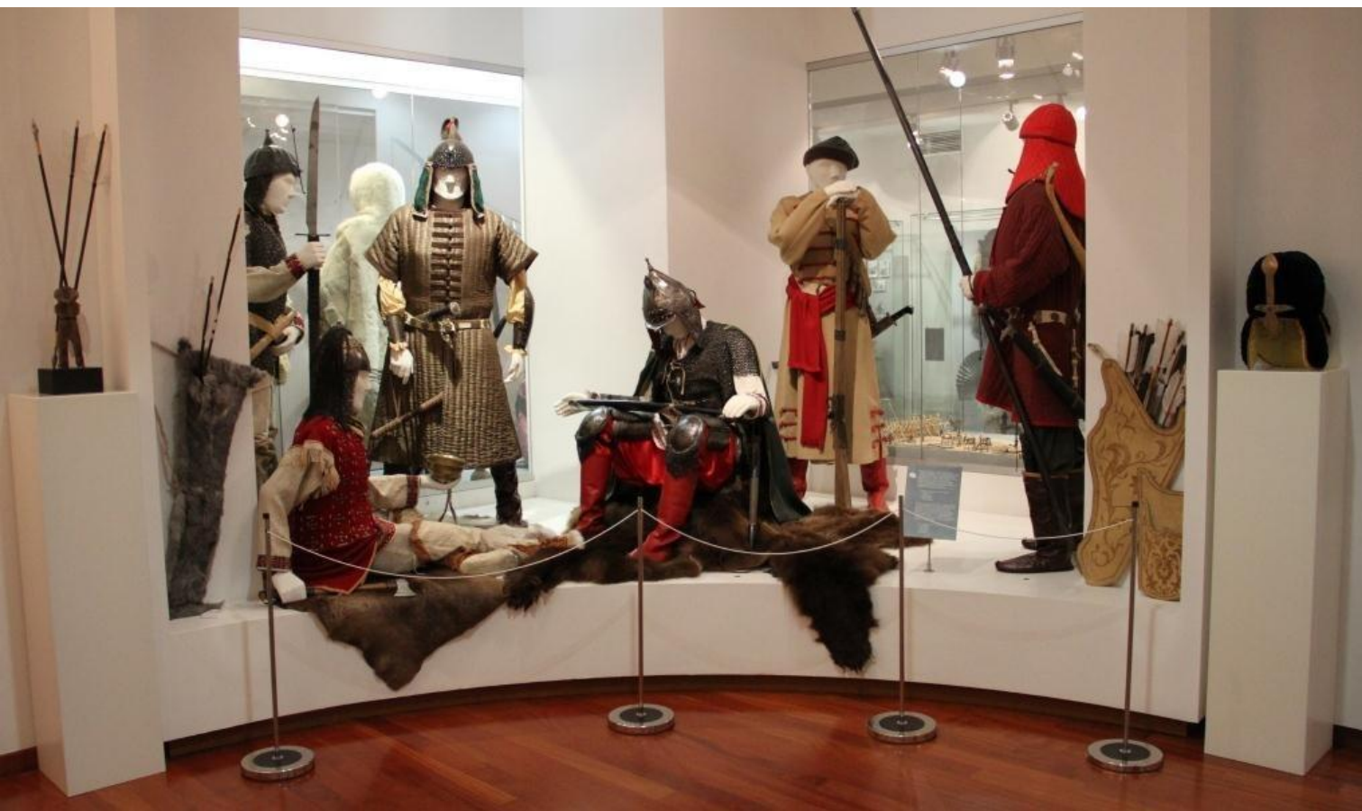
Экспозиция «Историческое время» (зал Сибирское взятие).